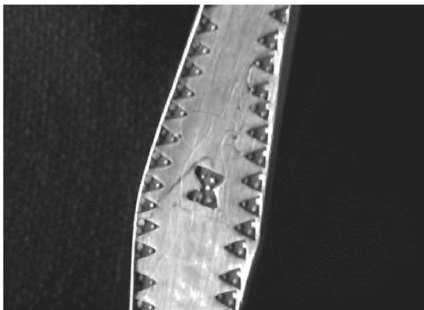
Figur 6.1: Endestykket fra Botnhamn. Graffiti-tolkes som en kvinnefigur.

Selv om historien i utgangspunktet knytter halsringen til en mann, ser vi altså en underliggende assosiasjon mellom en kvinnelig guddom (Frøya), ofring og halsringer. En detalj i det nordnorske halsringmaterialet kan også underbygge en assosiasjon mellom