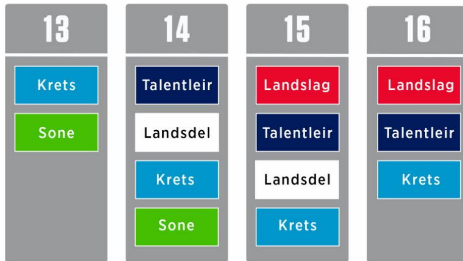
Figur 2: Nivåene i landslagsskolen ( https://www.fotball.no/barn-og-ungdom/spillerutvikling/landslagsskolen/struktur-og-rammer/#69709 )

tilbake til klubben. Tiltakene NFF tilbyr gjennom sine 18 kretser er bygd opp etter denne modellen: