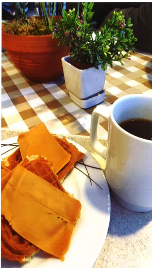
Kaffe og vaffel på Coop-kaféen.