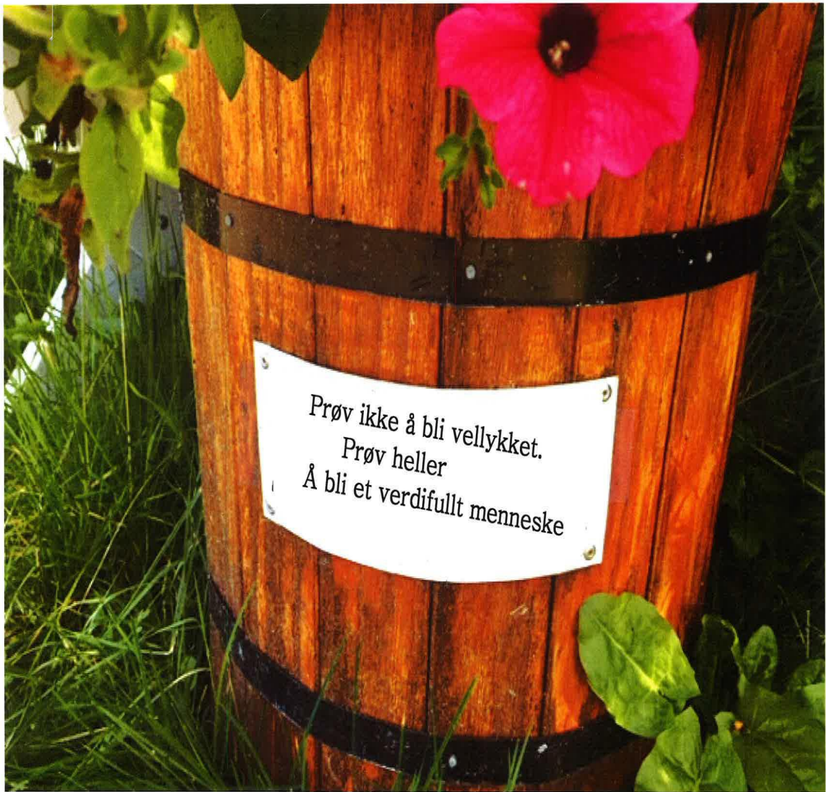
Visdomsord langs veien.