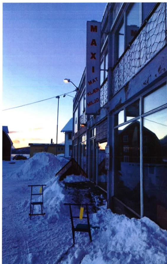
«Lån en spark», initiativ av Salangen næringsforening.