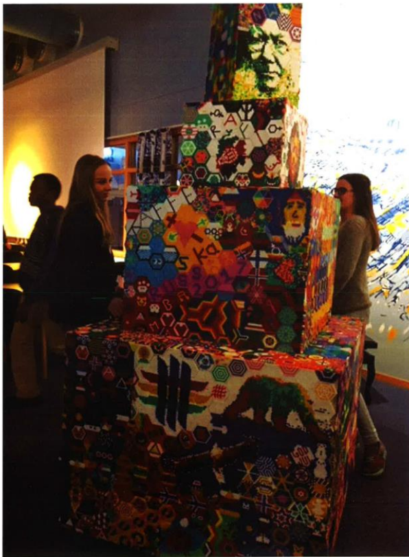
Perletårnet på Sjøvegan videregående skole.