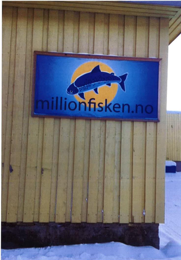
Over: Millionfisken. Say no more! Under: Kommuneskiltet til Salangen.