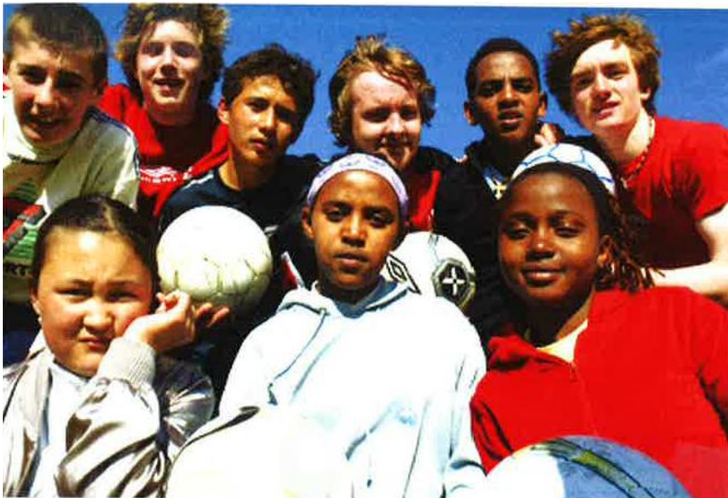
Under: VM i integrering på Heia.