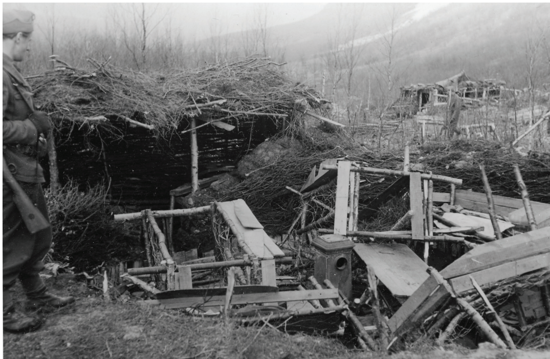
Figur 2. Fangeleiren Mallnitz, juni 1945. Mallnitz var leiren mange krigsfanger kom til, men som svært få forlot i live. Ovnene står ennå i dag, se figur 5.

og videreføring av den kulturelle arven er essensiell for vår felles forståelse av kulturarv (Arendt 1976:ix; Bangstad 2014:28-29). I Norge skapte etterkrigstiden og den kalde krigen en offisiell konsensus gjeldende okkupasjonsårene (Jasinski 2010:3), og tematikken ble aldri forløst, hvorpå mange av de problematiske aspektene rundt krigen ble fortiet gjennom en nasjonal og kanonisert erindring. Historieverk, dokumentarer og utstillinger har frem til nylig vært representert gjennom motstandskampen, det nasjonale og en konkret vestlig orientering, med et fokus på kampen mellom tyskerne og våre egne motstandsfolk, flyktingeløser og forkjempere (jf. Fjermeros 2013:260).