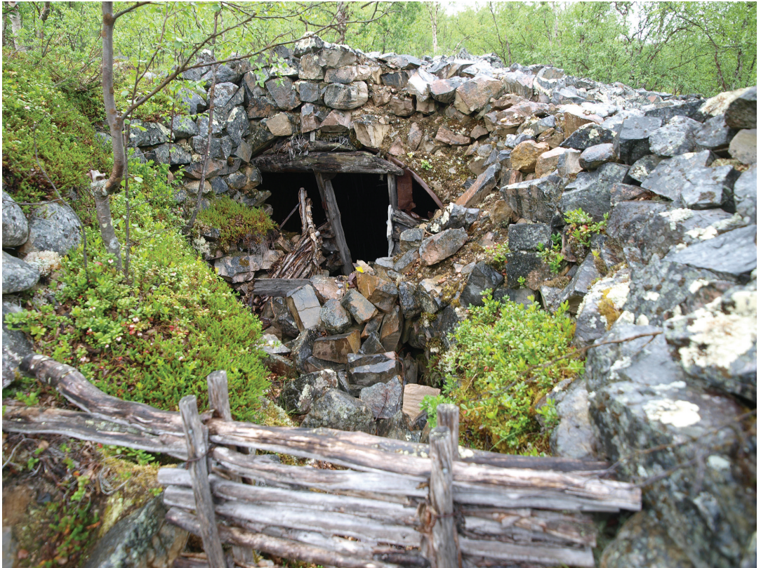
Figur 4. Dekningsrom i sitt naturlige livsløp ved Järämä.

kulturminnevernet utgjøre en fare gjennom å omskape disse materielle vitnesbyrdene til banale og ferdigtolkede steder som skal produsere og fremprovosere minner. Resultatet kan bli en overdokumentert fremstilling av en lokalitet som nøytraliseres og steriliseres gjennom tap av sin egenhet, annerledeshet og affektivitet (Buchli og Lucas 2001:9-10; González-Ruibal 2008:261; Olivier 2011:56-57). De kan og i verste fall ødelegge hva stedet faktisk er (Olivier 2001; Kobiałka 2014:362).