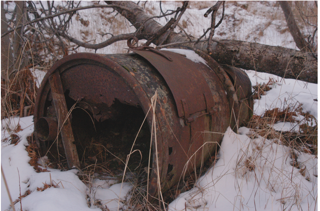
Figur 6. Den naturlige bevaringsformen har skapt en unik sammenblanding av natur og kultur i Norddalen.

som ruinenes progressivitet og aktive narrative egenskaper (Pétursdóttir og Olsen 2014b:4987) – egenskaper som er grunnleggende nettopp for hvordan vi kan oppleve den «lille historien».