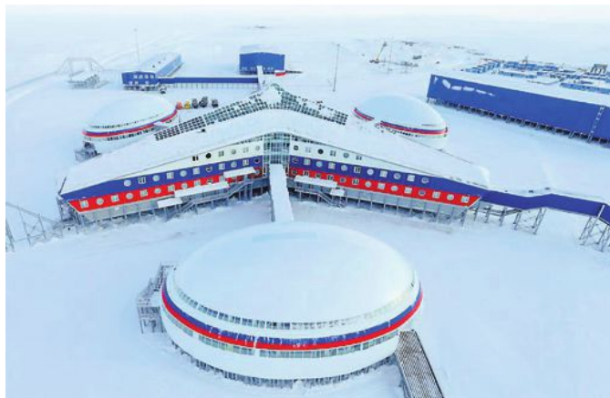
STOR OG MODERNE: Den nye militærbasen «Arktisk trekløver» på Franz Josef Land sto ferdig i 2016. Basen kan huse 150 mennesker, og har vinterhage, bibliotek og lekeplass, slik at den også kan tiltrekke kontraktssoldater med familier.

■ På initiativ av blant annet FSB, Det arktiske regionale grensedirektoratet, Polarforsknernes assosiasjon, samt Det arktiske og antarktiske fors-