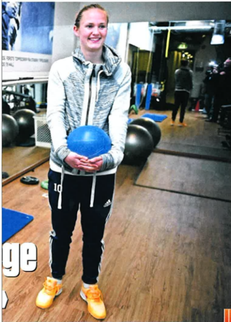
i styrerommet på Nadderud stadion i Bærum.

i Stabæk etter et halvt år i den svenske skandaleklubben Tyresö.