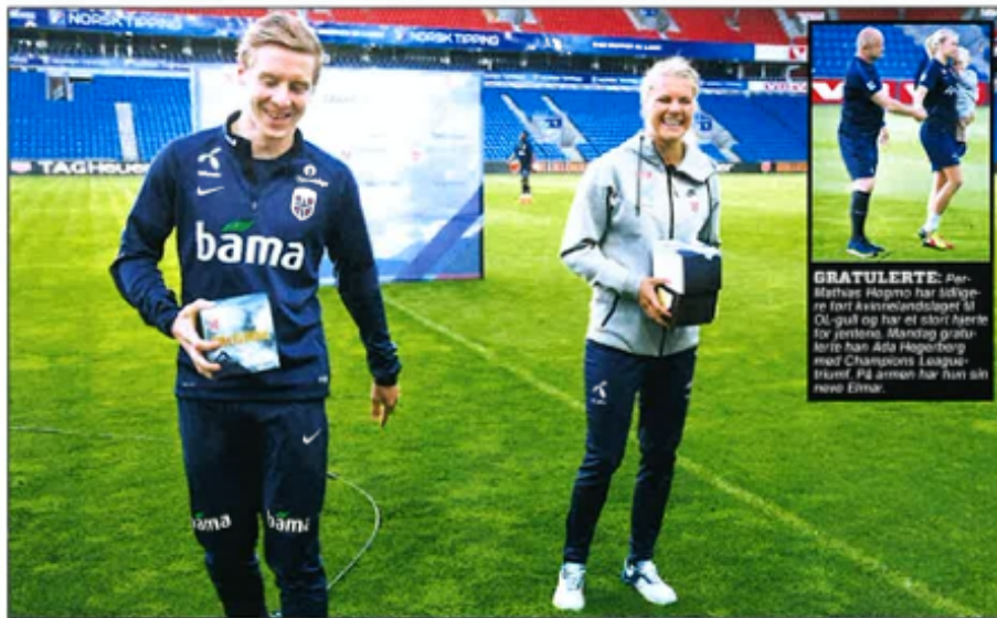
GRATULERTE: Per-Mathias Hogmo har ledigere for ansettelseslaget til OL-gull og har et stort fester for jentene. Mandag gratulerte han Ada Hegerberg med Champions League-titlen. På siden har hun sitt nye Elmar.