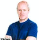
TROND JOHANNESSEN KOMMENTAR