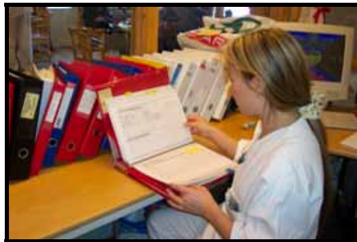
En student forbereder overtakelse av avdeling

Lærerne var entydige om at dette var en realistisk praksisform. Studentene lærte mye blant annet om å ta ansvar og ledelse. Det var også en god forberedelse til å arbeide som sykepleier. Kommunikasjon, samhandling og etikk var områder som ble identifisert, og dannet grunnlag for veiledning. Et flertall av lærerne mente denne form for praksis burde fortsette, forutsatt at noen av det faste personalet var til stede i avdelingen. Det var et stort antall studenter per lærer, og det krevde at lærer var praktisk sykepleiefaglig oppdatert. Det var enighet om at denne praksisen er krevende for lærerne på grunn av lang arbeidsdag, ubekvem arbeidstid og stor arbeidsbelastning. Lærerrollen burde av den grunn diskuteres nærmere.