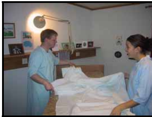
Studenter fra 1. studieår i aksjon

Evalueringene viste også at dette er en modell som anbefales videreført. Fordelen her var at studentene var vant til å arbeide sammen, og pasientene fikk færre personer å forholde seg til. Det har imidlertid vist seg at studentenes planlegging og gjennomføring har hatt flere mangler enn ved overtakelsene beskrevet i tidligere modeller. Vi tror dette kan ha sammenheng med at studentene ikke ser behovet for veiledning før de står oppe i situasjonen, og at sykepleierne mangler kanskje noe av lærernes veiledningskompetanse. Derfor tror vi det er nødvendig at skolen og praksisstedet i større grad står sammen om også denne type studentovertakelse.