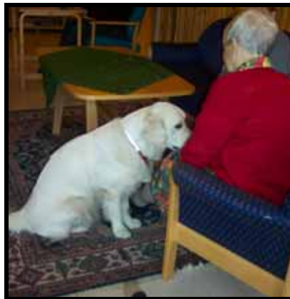
Hund som miljøarbeider