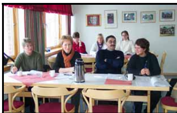
Ansatte i arbeid på fagdag

Annet personell (aktivitører, frisør, vaktmester, reinholdere osv) uttrykte også et behov for opplæring relatert til samhandling og møter med beboerne. Fra 2002 ble det gjennomført to timers undervisning for disse gruppene ved Undervisningssykehjemmet og øvrige sykehjem i kommunen. Fordi sykehjemmet og resten av kommunen hadde mange utenlandske sykepleiere ble det bestemt at disse også skulle tilbys en fagdag. Dette skjedde i 2002, hvor en tok utgangspunkt i utfordringer de som utenlandske sykepleiere møtte i sykehjemmet.