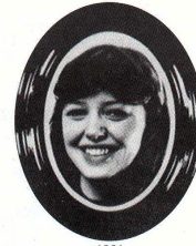
1981 Gry Luneborg Narvik