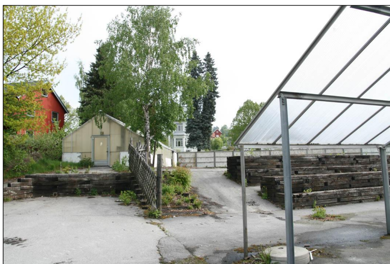
Figur 5: Utbyggingsområdet. Størstedelen av området som nå skal bygges ut, var tidligere gartneri.

Bebyggelsen i området har vært i konstant og kontinuerlig forandring og utvikling siden 1600-tallet, men i 1960-70 årene ble det startet et reguleringsarbeid for å få større kontroll over videre endringer og saneringer. Resultatet av dette arbeidet ble bl.a. reguleringsplanen ”Øvrebyen”, stadfestet 02.06.75. Deler av områdene ble da regulert til ”Spesialområde, Bevaring”, men området som 0704 Øvrebyen Park omhandler ligger utenfor disse områdene (Planbeskrivelse til reguleringsplan 0704, Øvrebyen Park).