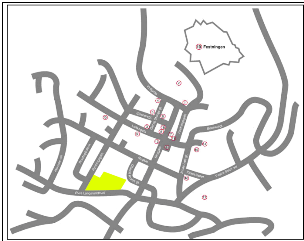
Figur 3: Kart over Øvrebyen med Øvrebyen Park har jeg her markert med gult. ( http://www.ovrebyen.no )

I 1975 vedtok kommunestyret en reguleringsplan som omfatter hele området og sikrer de historiske sidene ved området. Øvrebyen Park ligger innenfor reguleringsområdet (markert med gult på kartet)