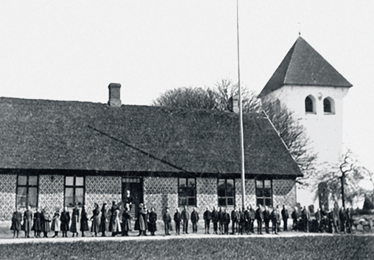
Skolhuset i Munka-Ljungby på examensdagen 1899. Här inhystes ortens sockenbibliotek. SPF Seniorerna Munka. Foto: Bringes med tilladelse fra SPF.

registrerade kvinnliga låntagare var generellt begränsad. I Nyed, Norn, Husie och Norra Solberga utgjorde de en handfull av sockenbibliotekens medlemmar, och i Svedvi och Munka-Ljungby uppgick deras antal till omkring 10 %. I många fall har dock troligtvis hela hushållet använt familjefaderns konto, och det är symptomatiskt att de flesta kvinnliga medlemmarna i sockenbiblioteket i Munka-Ljungby var änkor. När maken dog övertog änkan nämligen ofta kontot. I många fall kan det ha varit hon som från första början har varit den huvudsakliga låntagaren. Sjösten för fram hypotesen att kvinnor rent av utgjorde sockenbibliotekens huvudsakliga användare. 7