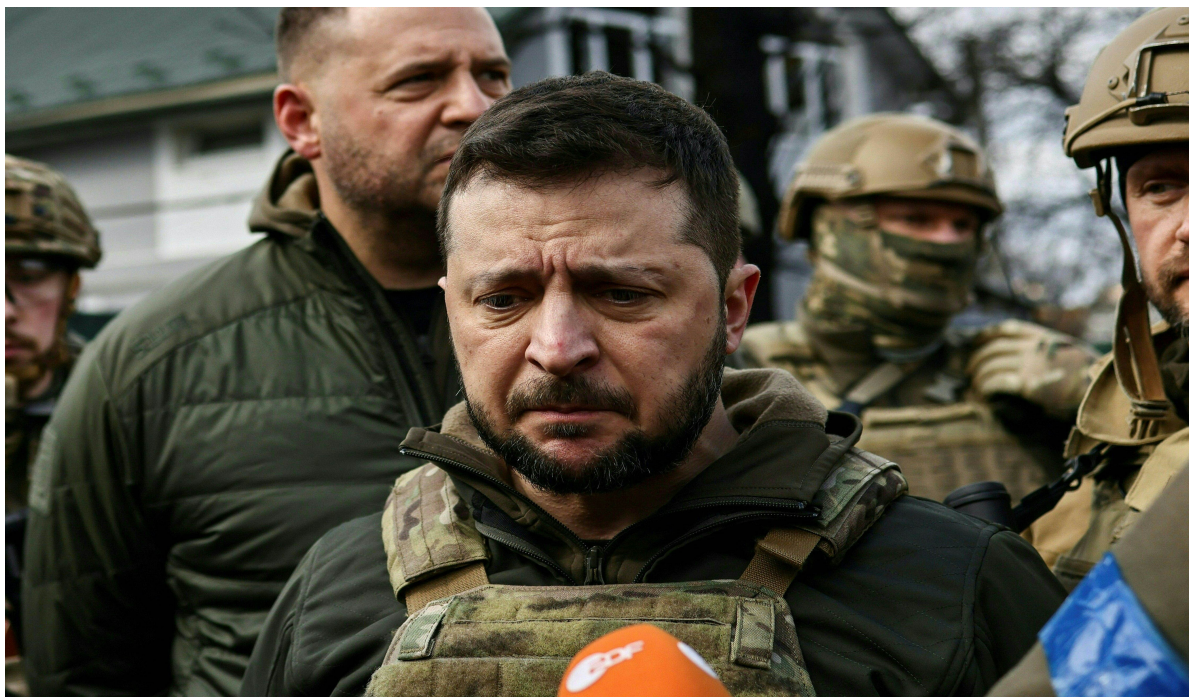
Figur 3