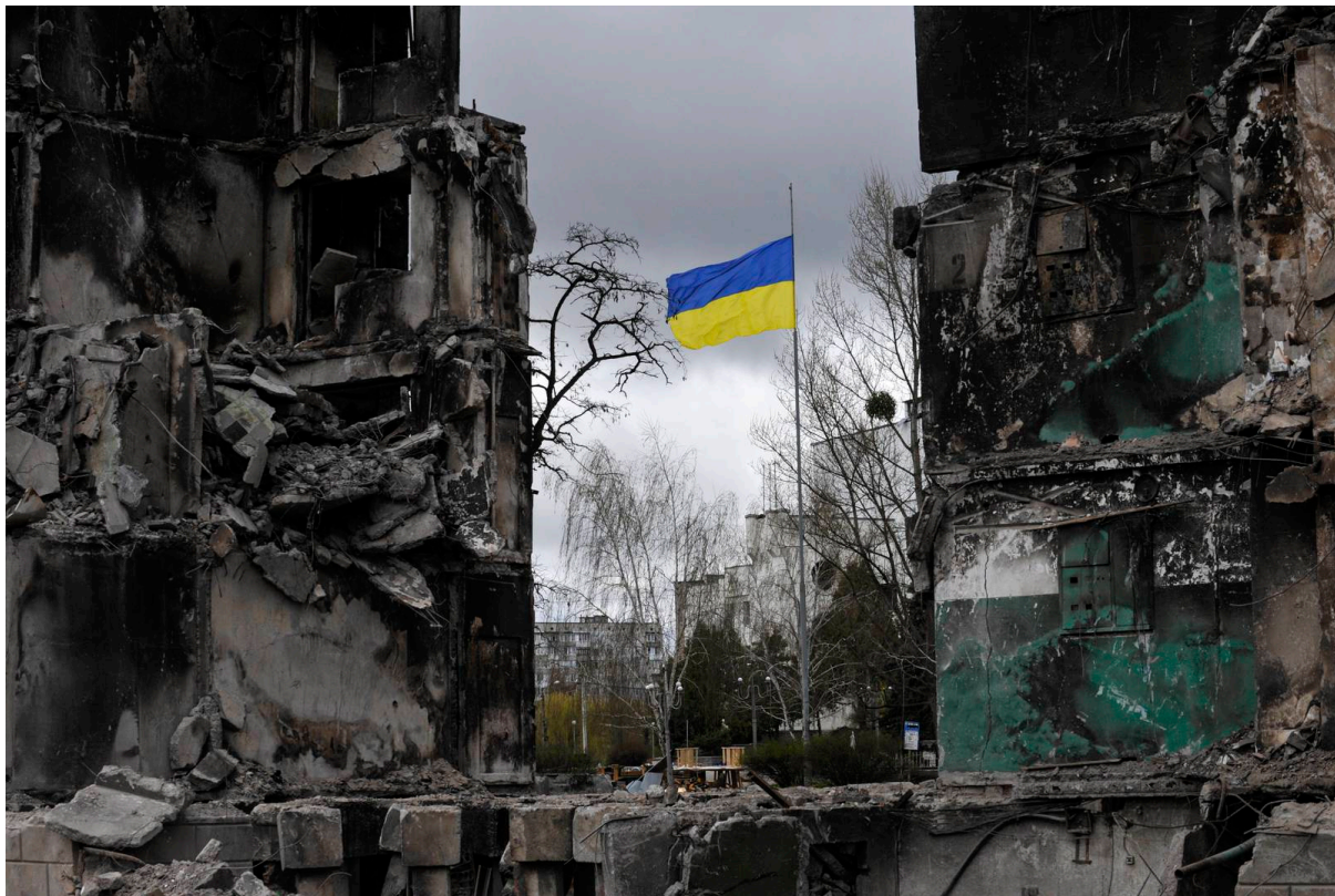
Figur 2 "Ukrainske byer i ruiner".

sammenstøt hvor over 100 mennesker mistet livet. Janukovytsj flykter til Russland 22. februar og Ukrainas parlament vedtar enstemmig å avsette presidenten og innsette en midlertidig regjering. Den nye regjeringen erklærer at de vil signere EU-avtalen, men Russland mente innsettelsen av ny regjeringen var et ulovlig kupp. Den 18. mars 2014 annekterte Russland offisielt Krim, og i september 2014 møtes representanter fra Ukraina, Russland, Tyskland og Frankrike i Minsk og forhandlet frem en våpenhvile. Den brytes og Minsk II-avtalen forhandles frem, men klarte ikke å stoppe konfliktene. Volodomyr Zelenskyj vant valget 21. april 2019 med 73,23 % av stemmene mot den sittende presidenten, Petro Prosjenkos. Etter Zelenskyjs valgseier fortsatte han Ukrainas nasjonsbyggings-prosjekt. Det er en klar draging om å knytte seg nærmere vesten ved både EU- og Nato-medlemskap, men 24. februar 2022 invaderes Ukraina av Russland, som utvides til en fullskala krig i Europa (Urban & McLeod, 2022).