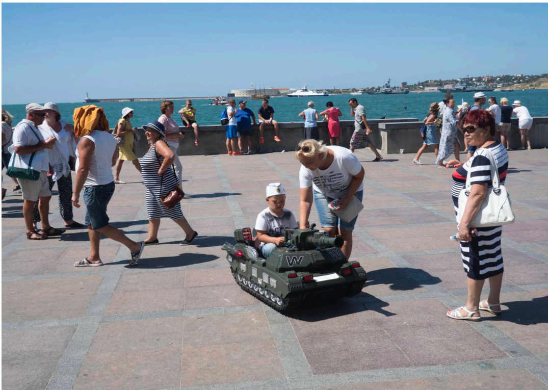
Figur 6 Den militære tilstedeværelsen i Sevastopol hvor blant annet den russiske marinens svartehavsflåte har en viktig havn.

Over ett år med krig og taler gjennom world wide web er han nå også utstyrt med kremen av vestlige våpen. Mens Hitler drepte for den ariske rasens «survival of the fittest», bruker Zelenskyj nå litt av sitt eget folk til å dø for det fremtidige demokratiet. Zelenskyj utfordrer tronen som verdensleder for fred. I alle fall symbolsk. Han har med åpne øyne satt i gang en krig for en bedre fremtid. Fortiden var ikke den identiteten han ønsket for ukrainerne, koster det hva det koster vil. Putin er beviset på at historien repeterer seg selv og krigen ser forbløffende lik ut som å «spille risk» med menneskelige brikker. «De gjenlevende herskernes - #WARME».