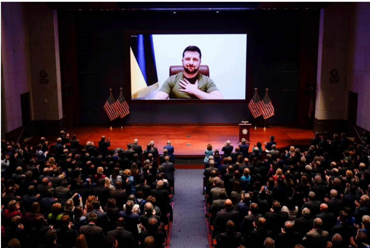
Figur 5 Tale via videokonferanse - U.S. Congress at the Capitol in Washington, D.C., the United States, mars 16, 2022.

folk i dag ikke bare hjelper Ukraina, men Europa og hele verden, med å bevare rettferdigheten i verden (Zelenskyj & Nyquist, 2023, s 107).