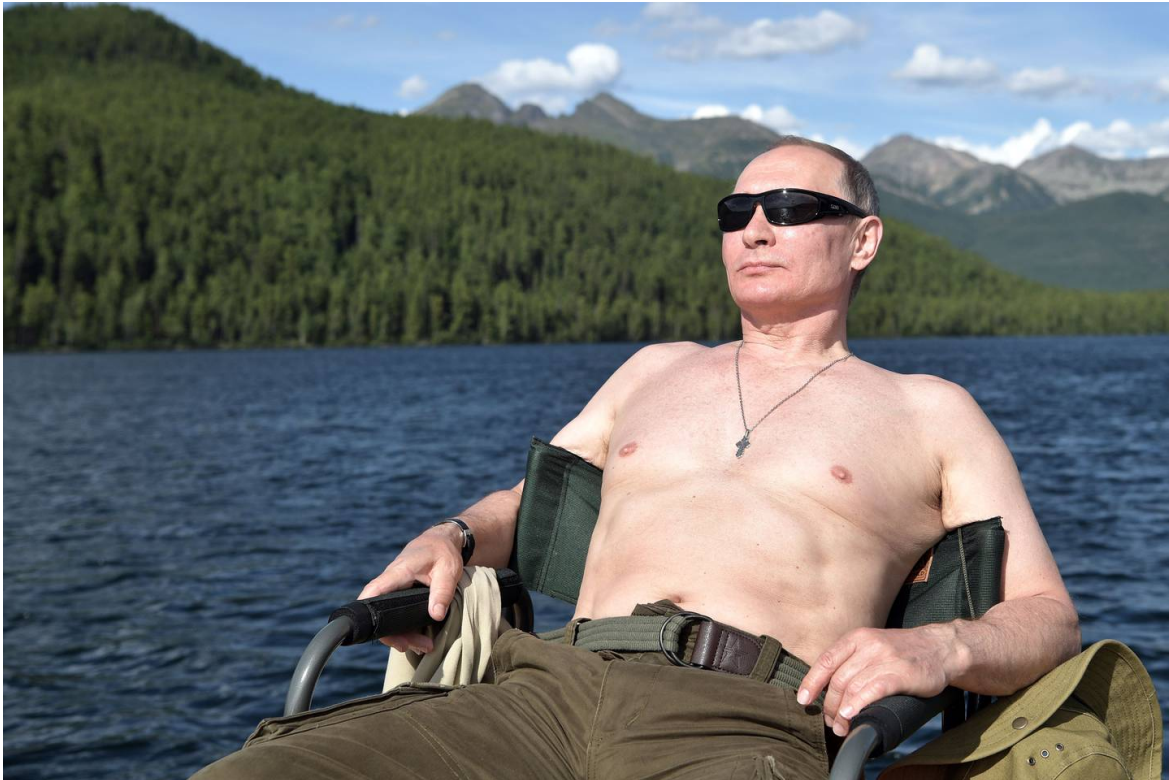
Figur 4 Fisketur i Sibir