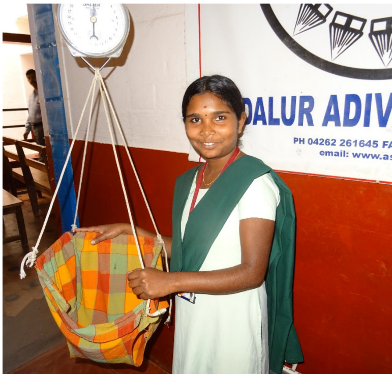
Gudalur Hospital, India

Alternativ eller skolemedisinsk behandling??