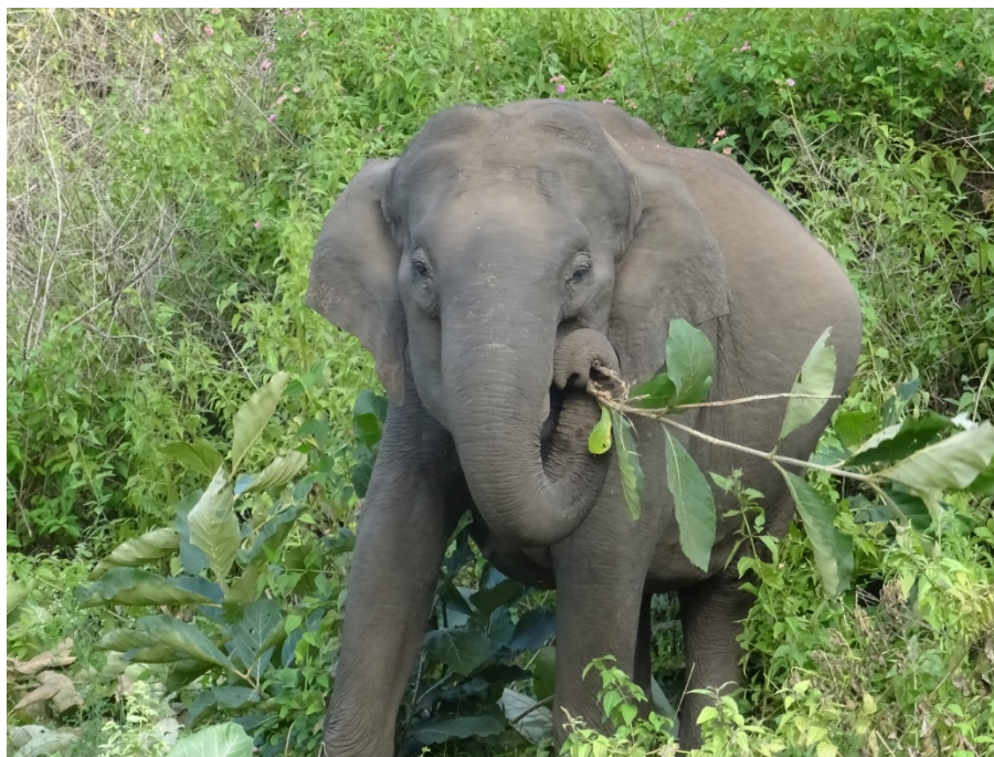
Bandipur national park, India

Bandipur Natural Park med tradisjonelle medisinplanter, tigre og elefanter !!