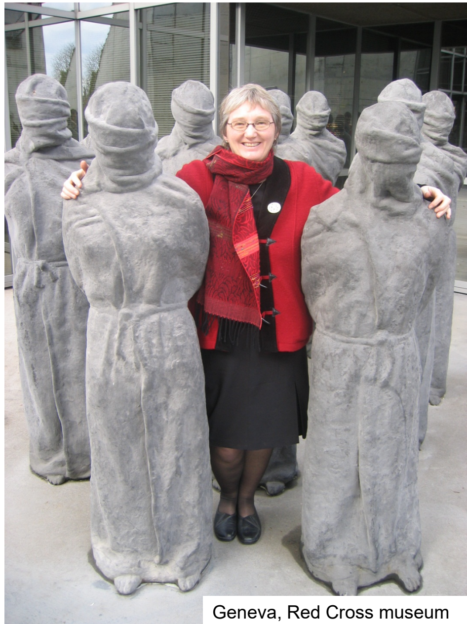
Geneva, Red Cross museum