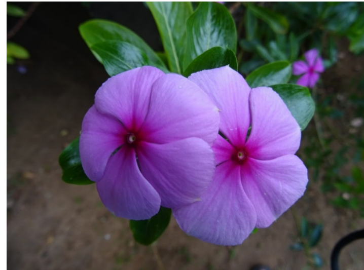
Gouri Farm botanical garden, Gudalur, India