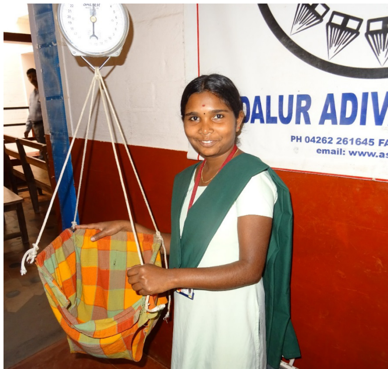
Gudalur Hospital, India

Alternativ eller skolemedisinsk behandling??