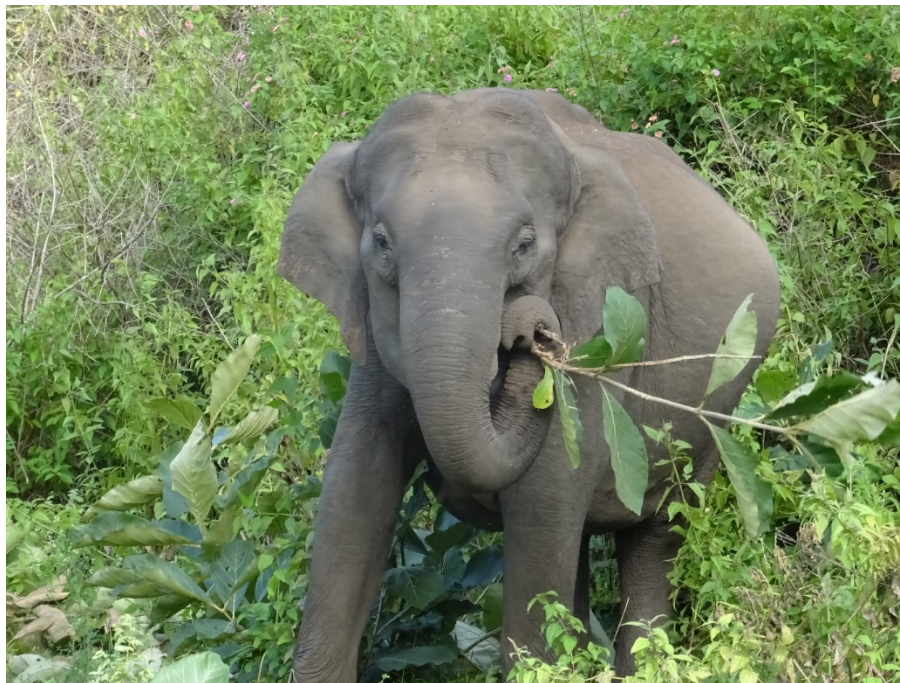
Bandipur national park, India

Bandipur Natural Park med tradisjonelle medisinplanter, tigre og elefanter !!