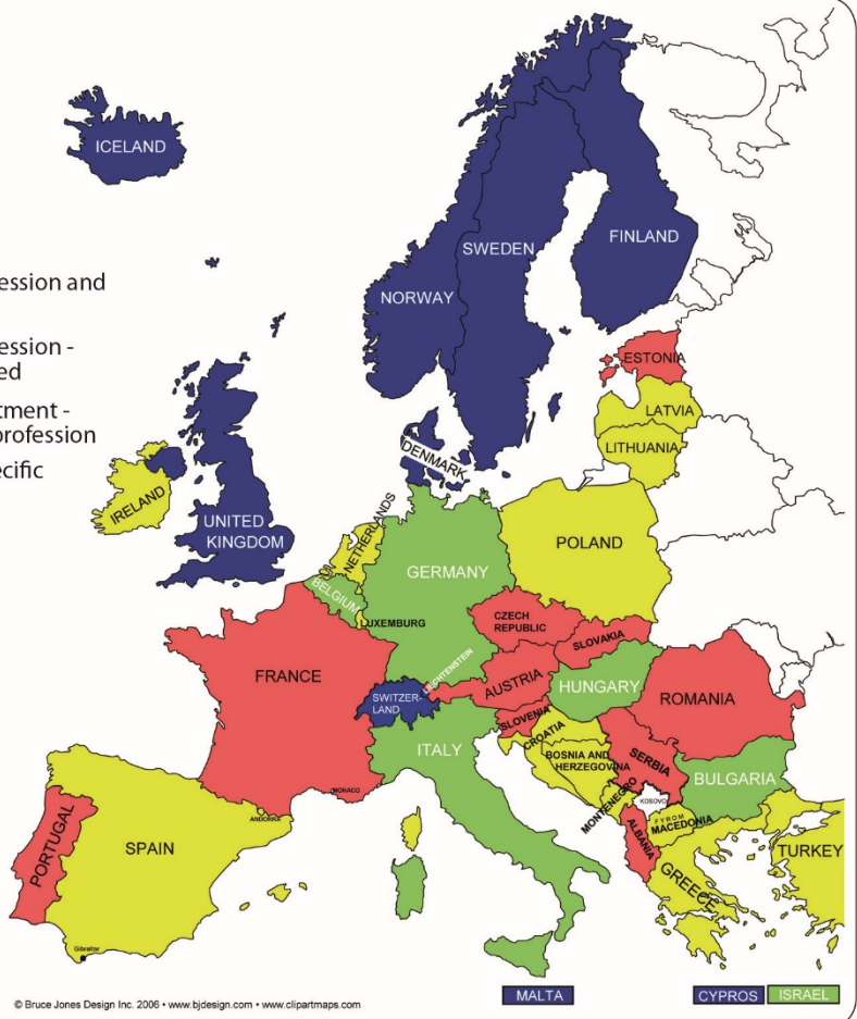
© Bruce Jones Design Inc. 2006 • www.bjdesign.com • www.clipartmaps.com