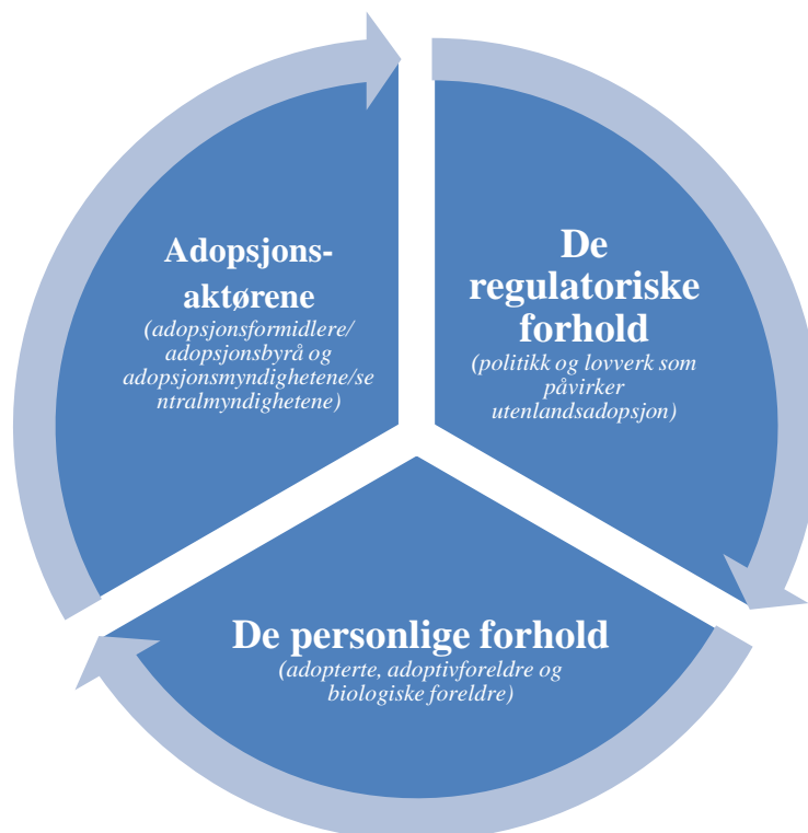
Illustrasjon 1. av omgivelsesforholdene.