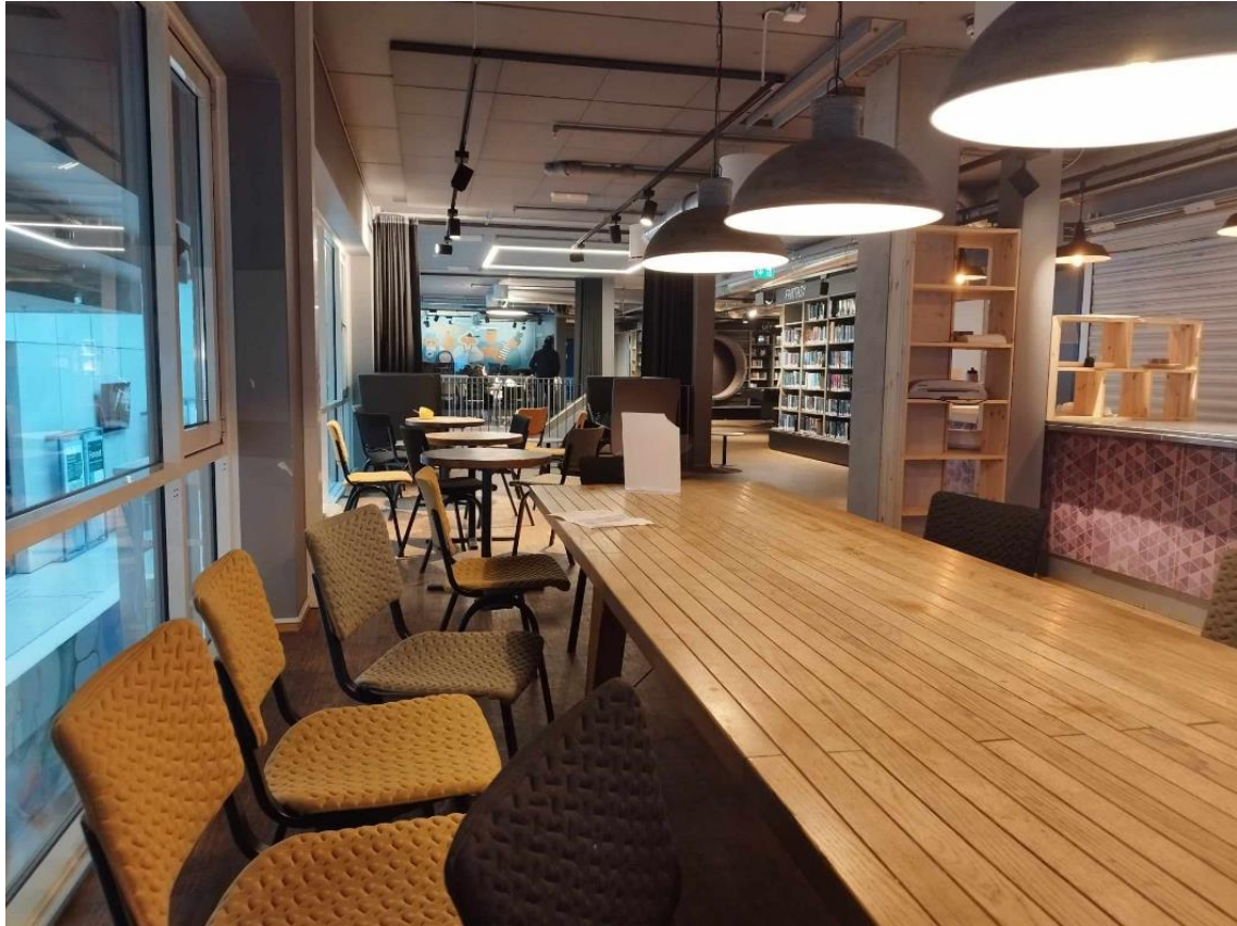
Illustrasjon 1. Et av langbordene som fungerer som samlingspunkt.