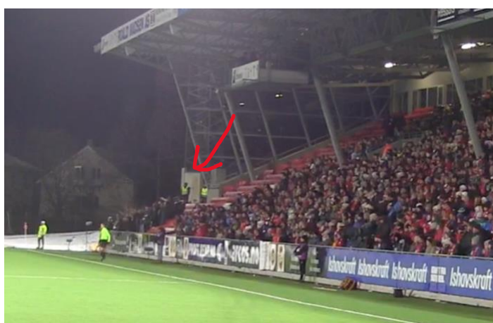
(Figur 3.3 - Bortesupporterne på seksjon H på vest-siden under TIL – Strømsgodset)

Her er øst-tribunen avbildet, også kalt Coop-tribunen. Øst-siden består av supporterklubben Isberget til venstre i bildet, VIP-en, øverst på langsiden og vanlige supporterplasser under der igjen. Tribunen ser ut til å være 70 - 80% full.