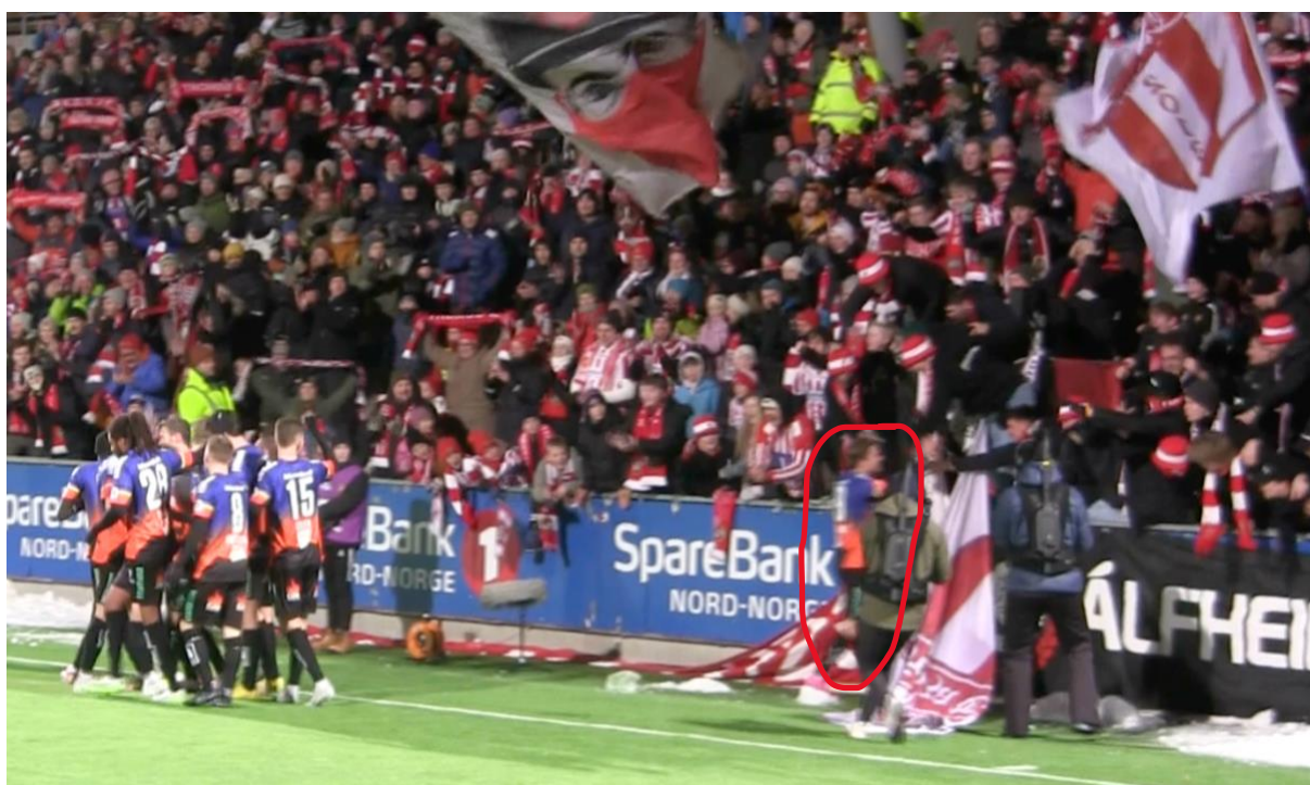
(Figur 3.11 – Bildet 2 av 2 - Tromsø skårer mot Haugesund)

«Ja, der har vi et sånt klassisk tilfelle at når skåringen kommer så blir det en sånn eufori og hele tribunen eksploderer på en måte. Og alle får på en måte en utløsning for den energien og så er det sånn at spillerne og da først og fremst han som skårer, han springer bort til tribunen for å feire sammen med supporterne, signaliserer til dem at, og vil være, får en sånn, kommuniserer med supporterne. (.....) Jeg tror kanskje det at det. Da er vi helt i toppen av skalaen» (Intervjuperson 4, sitat 36/43)