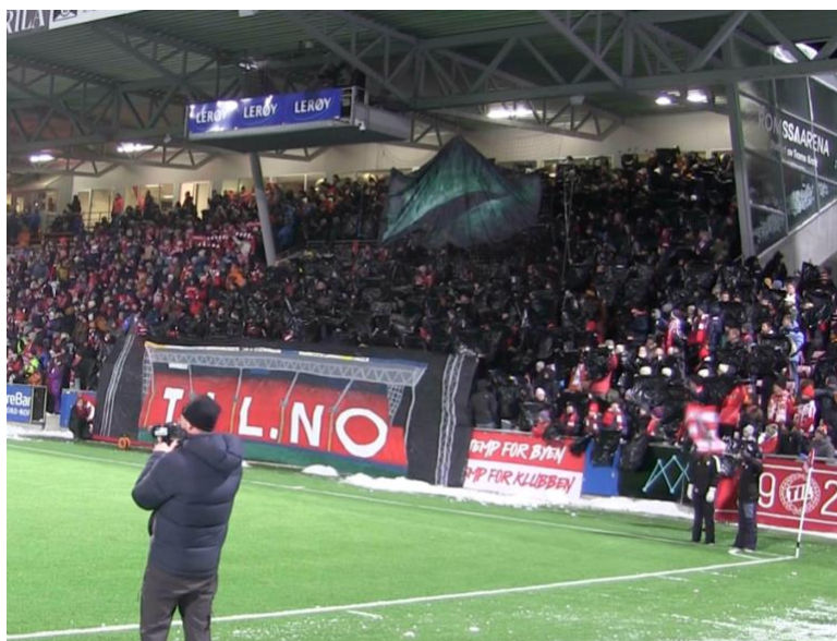
(Figur 3.5 – Forza Tromsø med TIFO)

Alle 1-5 intervjupersoner er enige om at det er av stor betydning å ikle seg enten en Tromsø-drakt eller å ta i bruk andre symboler som representerer Tromsø på tribunen blant andre hjemmesupportere. Symboler som nevnes er blant annet drakt, skjerf, sanger og TIFO. De forteller at det handler om å vise medfølelse, gi støtte til laget og at det er viktig med et kraftig og effektivt visuelt inntrykk. I tillegg nevnes det også at de gjør det for sin egen del for å bidra, men også komme i modus.