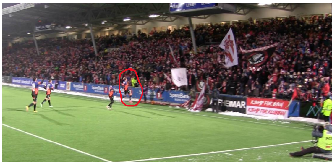
(Figur 3.10 – Bildet 1 av 2 – Tromsø skårer mot Haugesund)