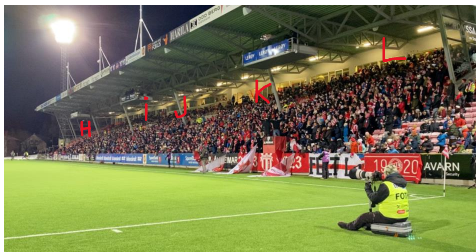
(Figur 3.1 – Vest-tribunen under TIL – Strømsgodset)

Man ser med en gang at supporterne er fysisk til stede på stadion. Når det kommer til plasseringen av supportere så har Romssa arena to hovedtribuner med tak og en sør-tribune uten tak. Den ene hoved tribunen blir kalt vest-siden og den andre øst-siden eller coop-tribunen. Sør-tribunen er for bortesupporterne og brukes normalt sett bare når det er stort oppmøte. Dette pleier å gjelde kamper hvor Tromsø spiller mot Bodø-Glimt, Rosenborg eller andre kamper som er av stor betydning. Når det ikke er stort oppmøte blant bortesupporterne så får de lov til å stå på seksjon H på vest-siden. Videre så finner man Forza Tromsø, den største supporterklubben til Tromsø IL på seksjon L på vest-siden. På motsatt side finner vi Isberget. Isberget er den minste av de to supporterklubbene og står på seksjon A på øst-tribunen. I tillegg er VIP tribunen øverst på langsiden på øst-tribunen.