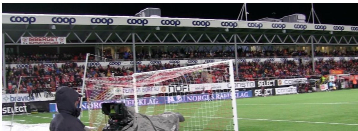
(Figur 3.2 - Øst-tribunen under TIL – Strømsgodset)

Her er øst-tribunen avbildet, også kalt Coop-tribunen. Øst-siden består av supporterklubben Isberget til venstre i bildet, VIP-en, øverst på langsiden og vanlige supporterplasser under der igjen. Tribunen ser ut til å være 70 - 80% full.