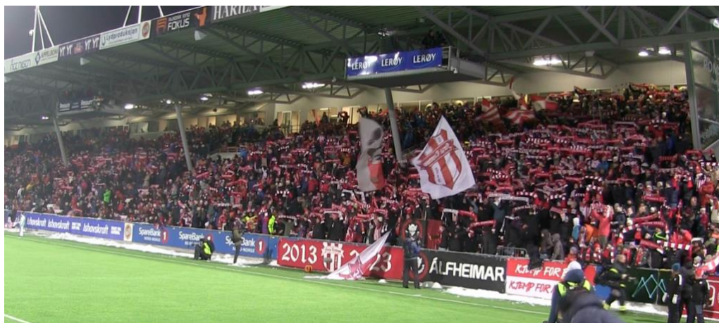
(Figur 3.7 – Hjemmesupporterne synger klubb hymnen)

Dette videoklippet (klipp 4) viser intervjupersonene et ritual under TIL - Haugesund hvor hjemmesupporterne synger klubb hymnen «Hjertet mitt har æ i Tromsø» samtidig som de holder skjerfet over hodet.