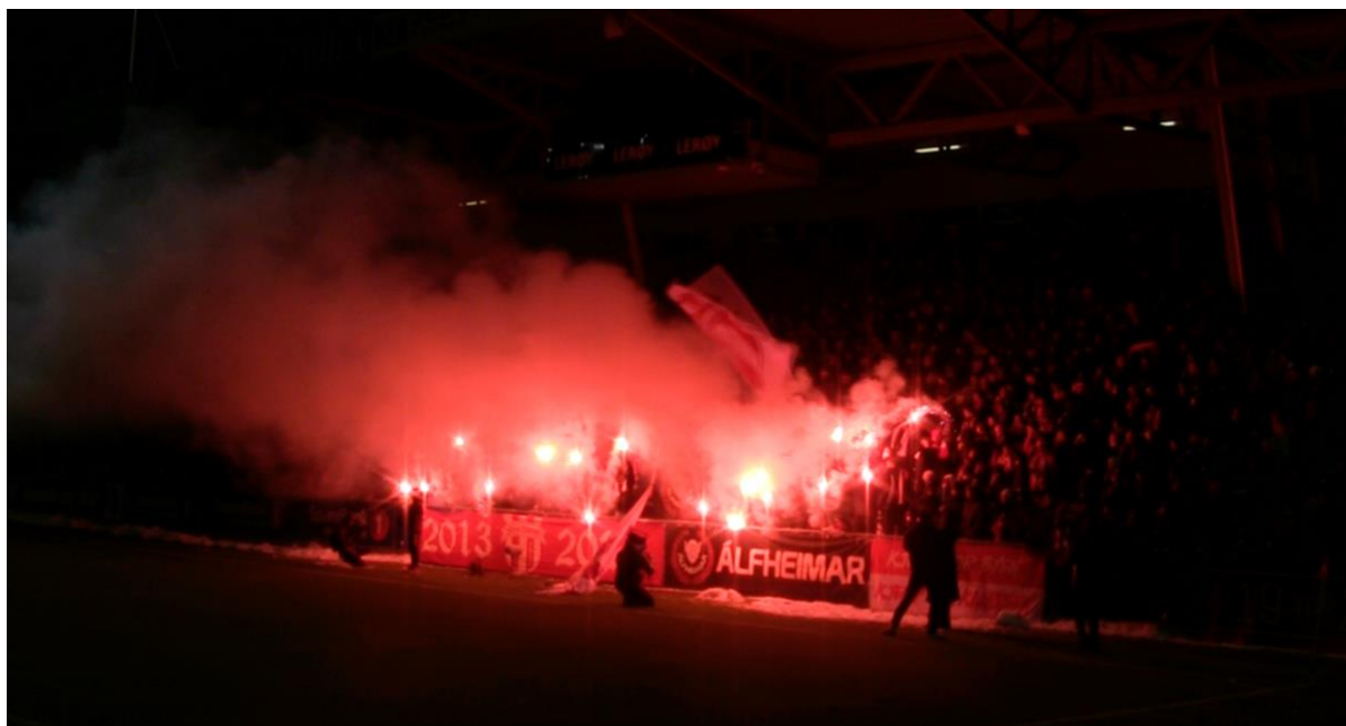
(Figur 3.8 – Forza Tromsø antenner bluss)

Bildet (klipp 5) nedenfor er et utklipp av videoen som intervjupersonene ble vist. Videoen er fra TIL – Haugesund og illustrer Forza sin bruk av pyro/bluss kombinert med felles klapping og sang.