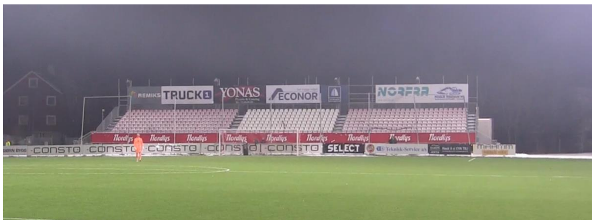
(Figur 3.4 - Sør-tribunen på Romssa arena)

Her utdyper intervjuperson 5 årsaken til at bortesupporterne får adgang til samme tribune som hjemmelaget, noe som egentlig strider mot fotballforbundets regler.