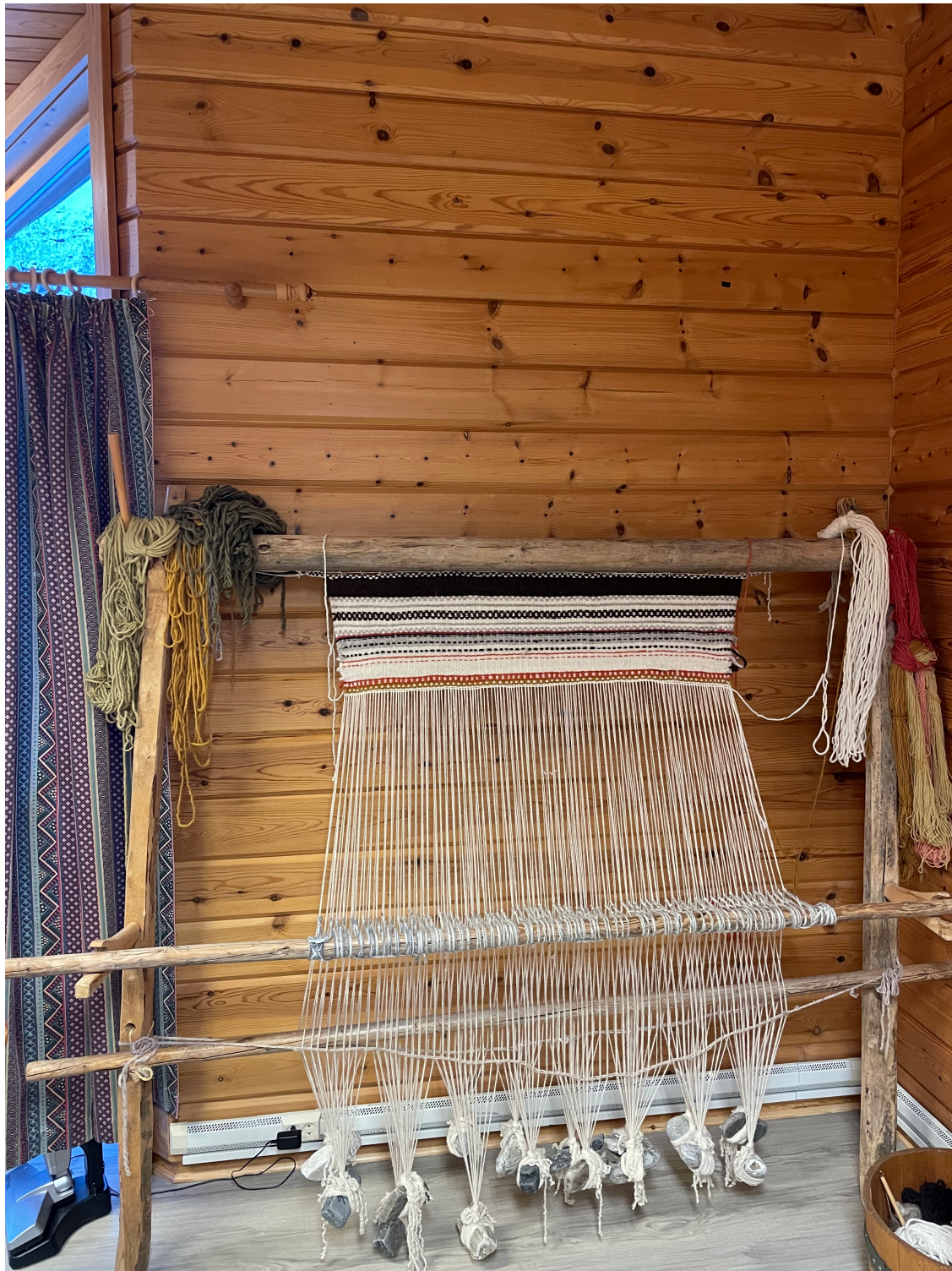
Figur 9. Oppstadvev med påbegynt prosjekt i arbeidsrommet i Grenebua i Mandalen.

Hjemme hos en av kvinnene fikk jeg omvisning i vevbua hennes. Langs den ene veggen sto oppstadveven. Det er en ganske kompleks konstruksjon, hvor steiner brukes til å holde rennene i strekk. Rennene er tynne ulltråder som man vever de tykkere ulltrådene rundt for å lage