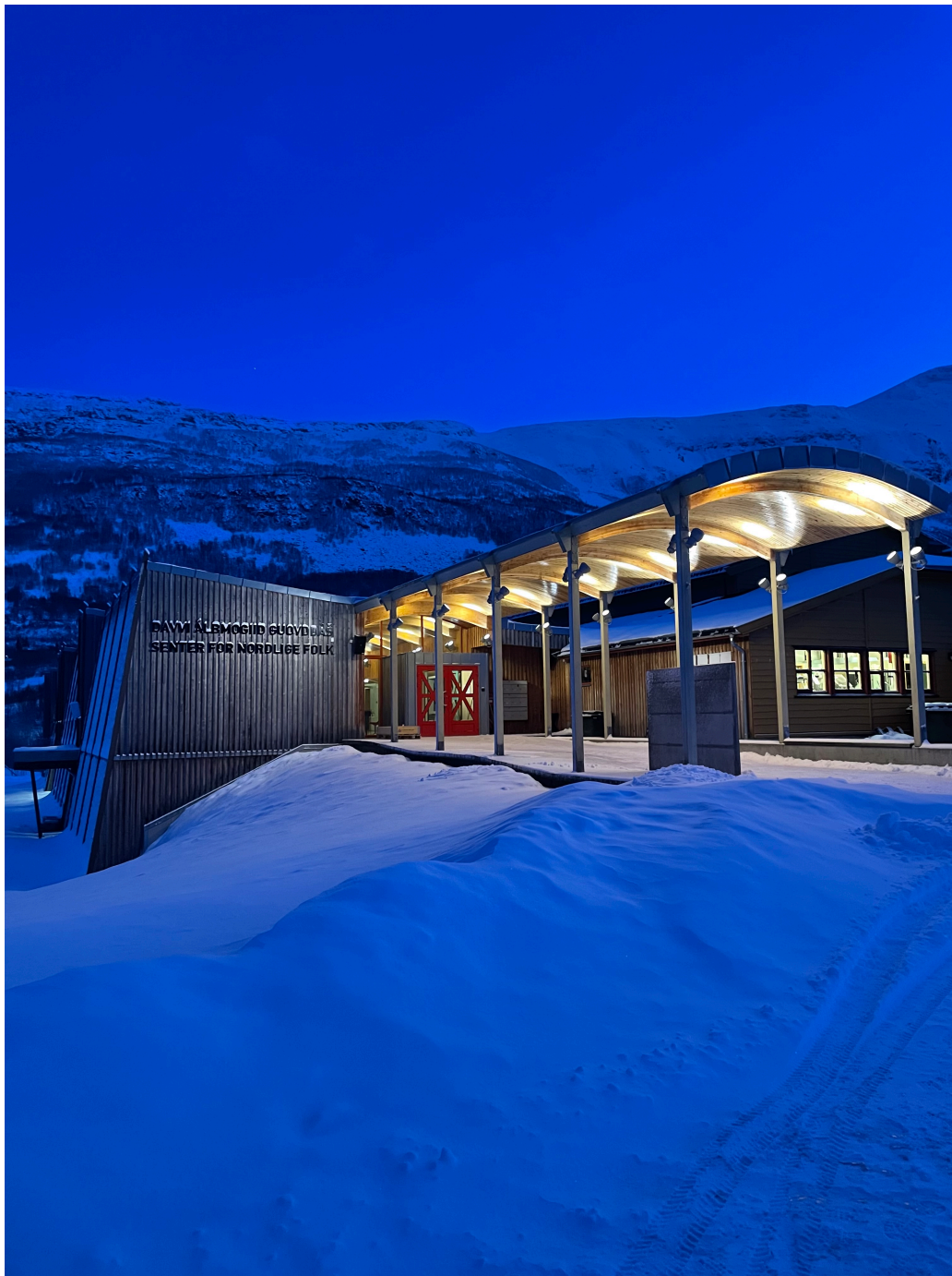
Figur 2. Senter for nordlige folk.

fordype meg i. Jeg dro videre til Senter for nordlige folk, og begynte å spørre dem jeg møtte om hvem jeg burde snakke med. De fleste anbefalte meg å sette meg i oppholdsrommet i den ene matbutikken og husfliden. Siden husfliden var stengt for dagen, satte jeg meg ned på pauserommet i matbutikken like ved. Jeg satt der alene i halvannen time før jeg bestemte meg for å kjøre hjem. Det var mørkt ute, og veien hjem til Tromsø var glatt, så jeg satt meg i bilen og kjørte hjem i rolig tempo.