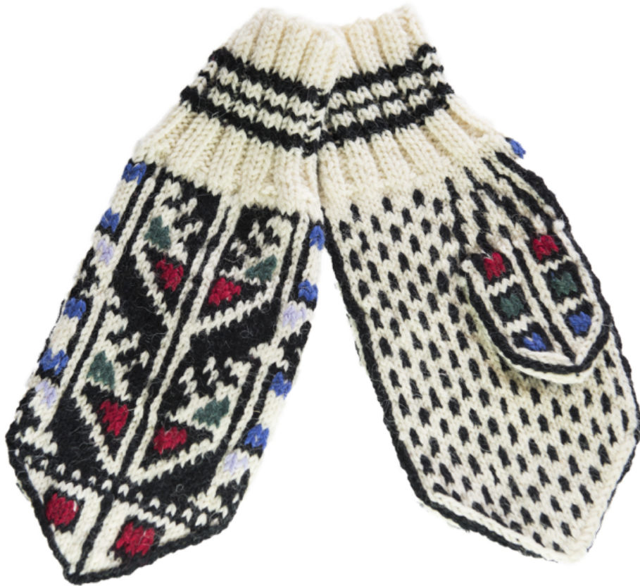
Figur 8. Votter med Mannaldsmønster.

Mannaldsmønsteret benyttes i dag til både votter, hansker, pannebånd ol. Mønsteret har vært i bruk i Manddalen siden rundt 1920, men har ukjent opprinnelse 9 . Produktene strikkes i sort og hvitt garn før fargene broderes inn. Dette mønsteret viser ikke til noen lokale egenskaper, men er mye brukt og godt dokumentert fra mellomkrigstiden til nå. Mønsteret er lett gjenkjennelig, men er ikke like symbolsk stedlig forankret. Valg av farger og detaljer i broderiene varierer ut fra hvem som lager de. Det er derfor mindre fastsatte krav til hvordan de skal se ut, men mønsteret er likevel lett gjenkjennelig. Kvinnene fortalte ikke så mye om dem, ut over at de har blitt brukt der i over 100 år.