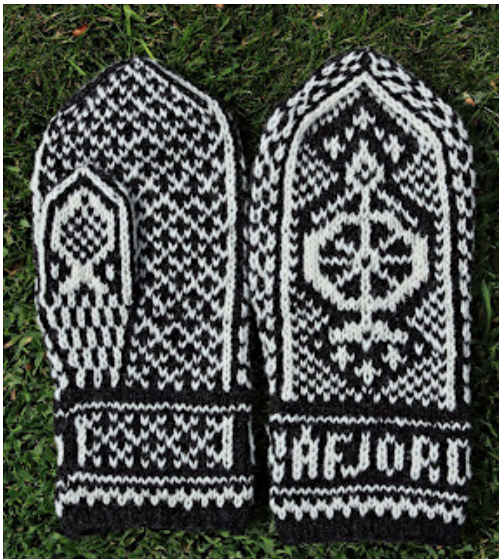
Figur 6. Kåfjordvotten.

Kåfjordmønsteret viser symbolikk som er gjeldende for hele kommunen og viser et slående eksplisitt og aktivt kjønna stedsarbeid, hvor arbeidsfordelingen illustreres ved å snu votten.