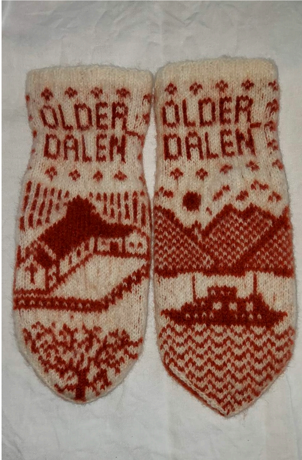
Figur 7. Votter med mønster fra Olderdalen.