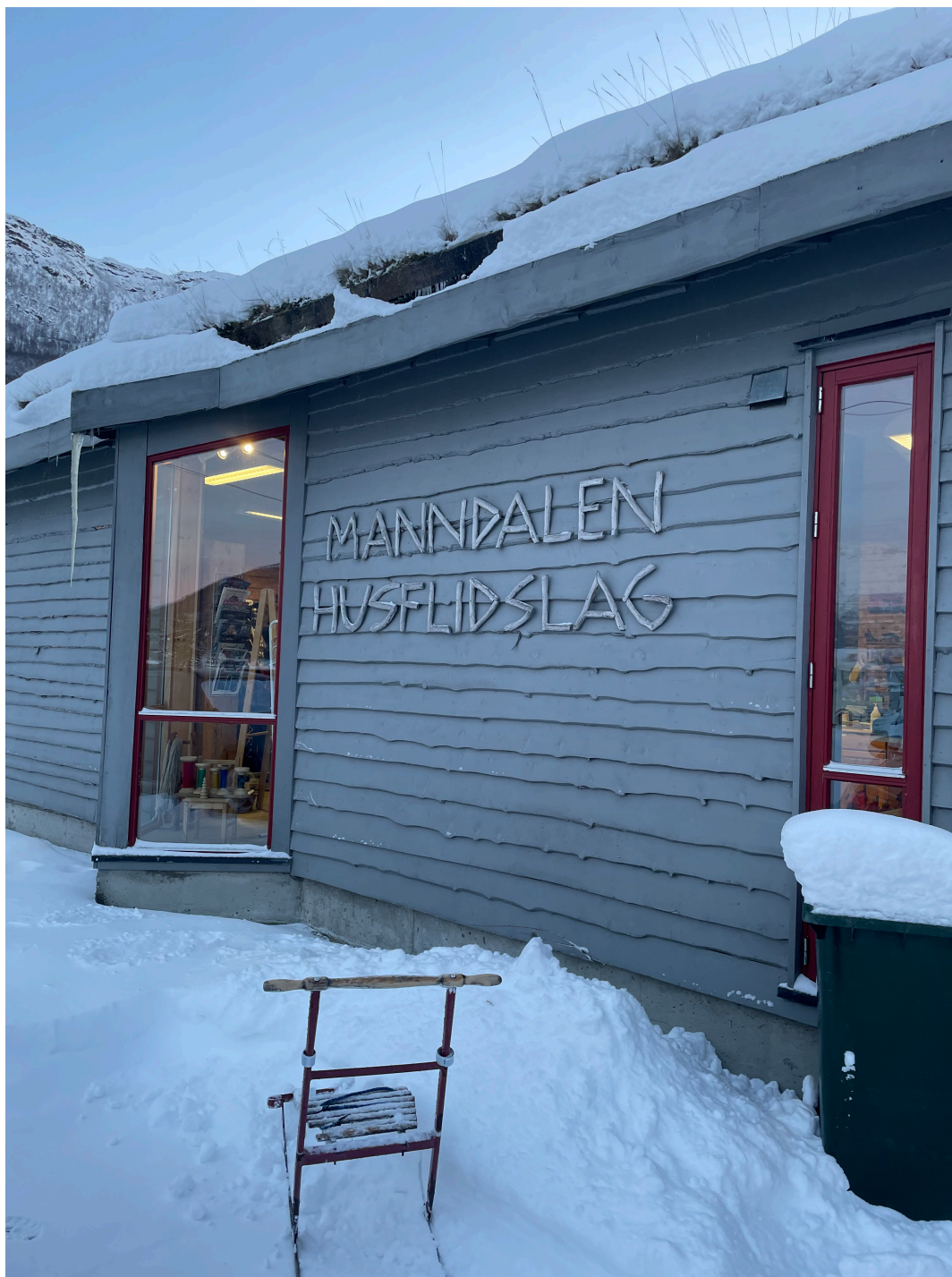
Figur 3 Grenebua i Manndalen og sesongkjøretøy.

Før neste tur til Kåfjord hadde jeg begynt å undersøke husfliden der. Jeg dro tilbake et par dager senere og satte meg inn på husfliden.