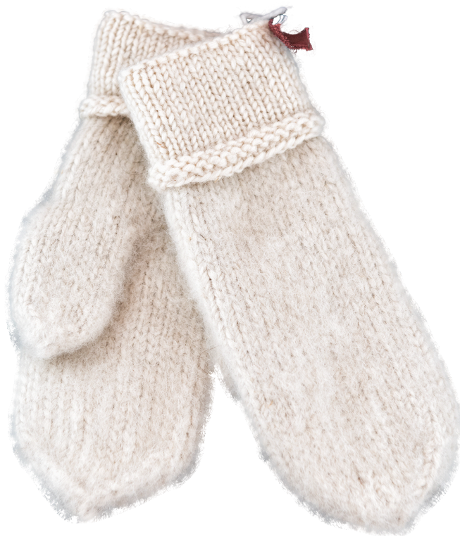
Figur 5. Bonkosvotter. Fra Manddalen Husflidslag https://manddalen-husflidslag.no/produkt/bonkosvotter/

Kvinnen fortalte at de ikke hadde garnet inne, men at de nylig hadde sendt bestilling, og at garnet skulle være ferdig om en måneds tid. Jeg fikk et annet type garn så jeg kunne øve meg på å strikke votter, og fikk beskjed om at jeg måtte komme tilbake senere hvis jeg ville strikke bonkosvotter. Jeg stusset på at det var så lang leveringstid på garn, men nøyet meg med invitasjonen tilbake. Jeg satt meg ned for å bla i disse brosjyrene og så at bonkosvotter strikkes av uvasket, hjemspunnet garn og at vottene skal kardes når de er ferdigstrikket. De karder vottene ved å ta en børste og grer opp ulla slik at det blir et «ekstra lag» ull som tetter hullene mellom maskene. En kvinne som satt ved siden av meg fortalte at bonkosvotter er «verdens varmeste votta», og at de har blitt med eventyrere på flere polferd og over Grønland. Hun fortalte at de varmer så godt fordi det er lagt så mye flid i dem. Først må man sende bestilling til ullkarderiet i Birtavarre – Løvli naturull. Videre spinner husflidens medlemmer ulla til garnnøster på rokken. Denne prosessen tar lang tid, og det er ikke så mange av medlemmene som spinner.