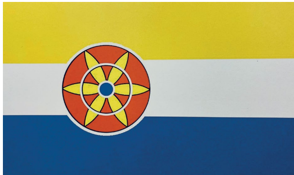
Kåfjord Kvenforenings forslag til kvensk flagg (2015).