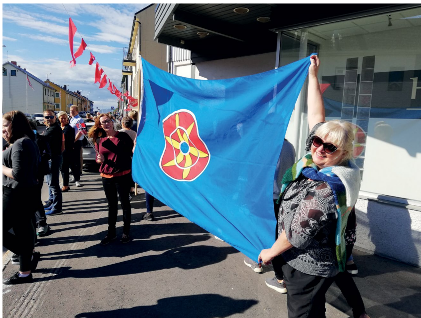
Kvenflagget vises fram under sykkelrittet Arctic Race of Norway 2018.