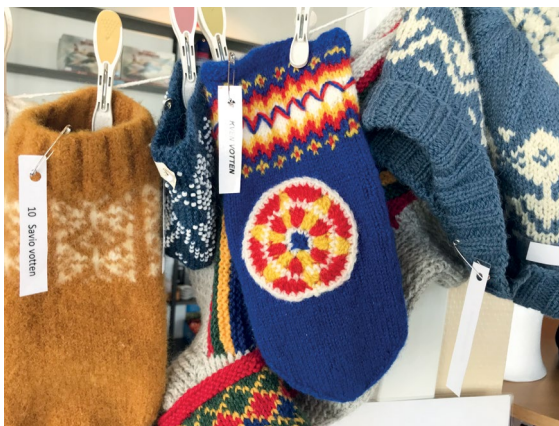
«Kvenvotten» med kvensk flaggmotiv til salgs på Grenselandmuseet i Kirkenes (2022).

Langt fra alle flagg blir produsert i fabrikk. Særegent for den kvenske flaggproduksjonen er den store mengden flagg og flaggprodukter som lages for hånd. I 2018 laget deltagerne under Halti kvenkultursenters språk- og kulturleir i Sappen egne kjøleskapsmagneter med flaggmotiv (Hansen, 2018, s. 13). I 2020 arrangerte Nordnorsk kunstnersenter, som del av prosjektet «Kvensk/norskfinnsk tradisjonskunnskap i møte med ei ny tid», en treskjærerworkshop i Vadsø hvor man arbeidet med flaggmotivet (Lanes, 2020b). Matematikeren Hilja Huru har utarbeidet et eget prosjekt med kulturbaserte læringsaktiviteter i matematikk og naturfag for barn og ungdom hvor tegning/design av flagget står sentralt (Monsen, 2019a). Kvääninuoret/Kvenungdommen har tatt initiativ til en såkalt samstrikk hvor deltagerne strikker sine egne kvenvotter med flaggmotiv. Facebook-gruppen for samstrikken har samlet over 200 medlemmer (Kvääninuoret, u.å.).