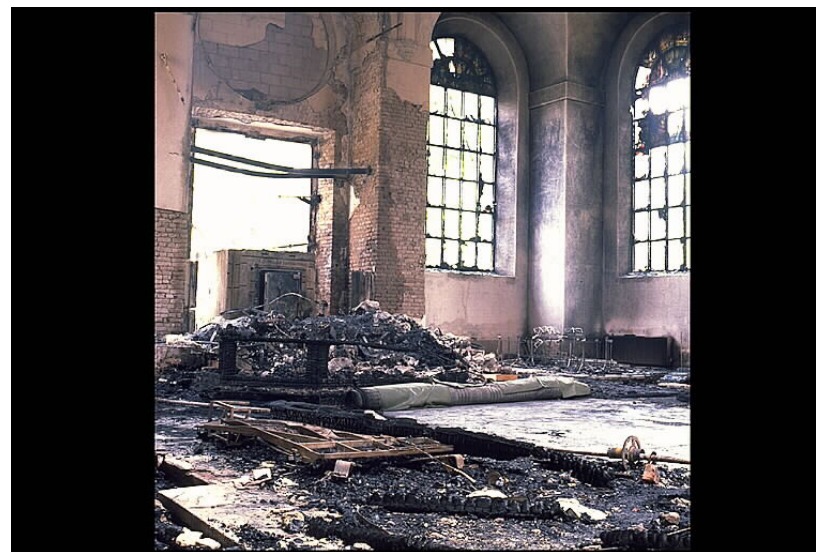
Katarina kyrka i Stockholm efter branden 1990.

Spiran hade bytts ut i samband med restaureringen i mitten av 1800-talet, den som Lassus och Viollet-le-Duc skrev sin bok om. I restaureringen som genomförs nu funderade man först på att ersätta spiran med en annan konstruktion men bestämde sig för att göra en likadan som på 1800-talet. Spiran görs i trä och runt tusen ekar har fällt för att konstruera en ny spira.