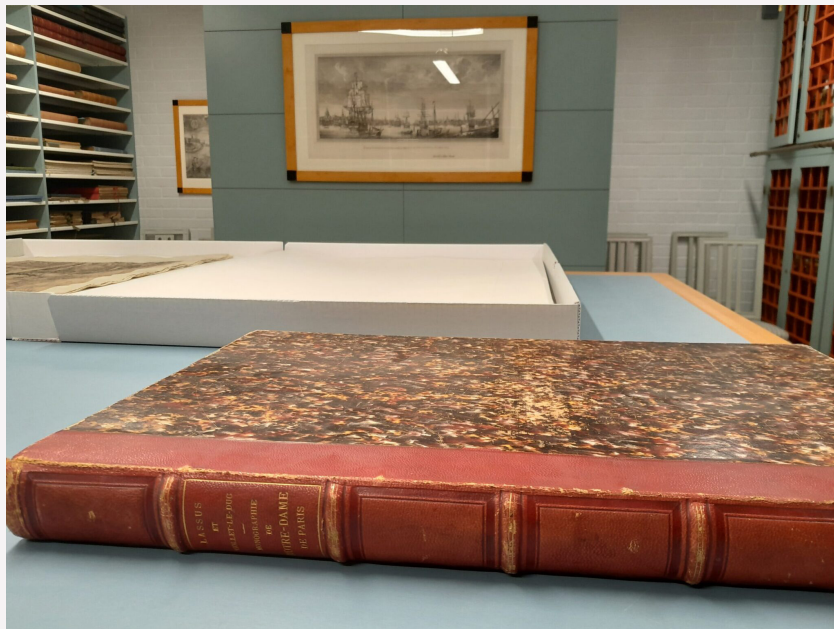
Vid Riksantikvarieämbetets publika arkiv och bibliotek finns många böcker om medeltida arkitektur och konst. Bland annat denna bok om katedralen Notre-Dame av franske arkitekten Jean-Baptiste Lassus, som i mitten av 1800-talet var med och restaurerade katedralen. 2019 utbröt en stor brand i katedralen och den var nära att totalförstöras. Med hjälp av bland annat kunskap från tidigare restaureringar arbetas det nu intensivt med katedralen. Till jul 2024 räknar man med att kunna fira gudstjänst igen i Notre-Dame.

Riksantikvarieämbetet https://www.raa.se