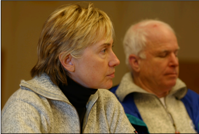
Fig. 3. Hillary Clinton under sitt besøk på Svalbard i 2004. Hennes engasjement for Arktis har vært stort.

Nå var det USA som motsatte seg at Arktisk Råd ble ytterligere marginalisert og skjøvet ut på sidelinjen i polarpolitikken. Med andre ord: Amerikanerne tok en utenrikspolitisk helomvending.