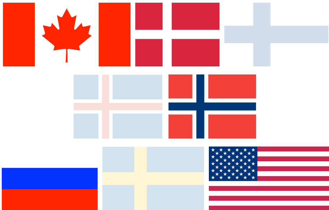
Fig. 2. Bare fem av de åtte arktiske landene diskuterte Arktisk Råd i Ilulissat i 2008.

Utfordringene de fem pekte på omtales gjerne som high politics , det vil si temaer som berører sikkerhet, suverenitet og suverene rettigheter. Gruppen på fem diskuterte altså temaer i Ilulissat som eksplisitt er blitt holdt unna Arktisk Råd.