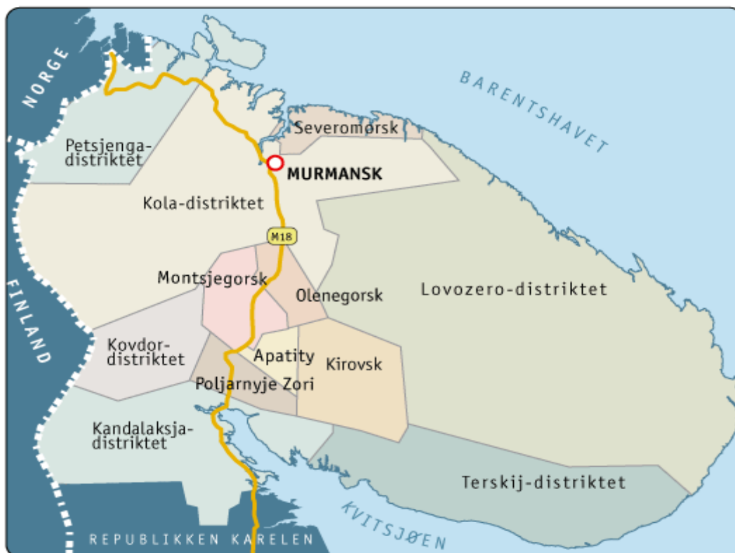
Kart over Murmansk oblast

I dette kapitlet vil jeg analysere materialet i avisene fra Murmansk oblast. Til sammen har jeg samlet inn materiale fra fem aviser i oblasten, i perioden 1944 til våren 1948. Avisene jeg har benyttet meg av, er utgitt i ulike deler av oblasten, fra helt opp mot norskegrensen til steder som byen Kirovsk, som ligger mer sentralt i regionen. Det jeg ønsker å se på er om avisene tar opp saker som nevner Norge, eller Norden. Jeg vil også se om det gjennom leserbrev kommer frem en holdning til utlandet. I dag finner man mange leserbrev som uttrykker skribentens holdning til andre land. Dagens situasjon i Norge med ytringsfrihet kan selvfølgelig ikke automatisk overføres til Sovjetunionen på 1940-tallet. Men jeg tror det kan være mulig å se hvor fritt man kunne uttrykke seg, ved å se på innholdet i leserbrevene. Så selv om de ikke inneholder noe om Norden, kan de gi en pekepinn på hvor stor grad av ytringsfrihet det var. Siden jeg har med fem aviser, er det også mulig å se om det finnes et skille mellom avisene innad i oblasten. Det er derfor jeg har også valgt aviser fra steder som er lengre unna riksgrensen. Se kartet under. 62