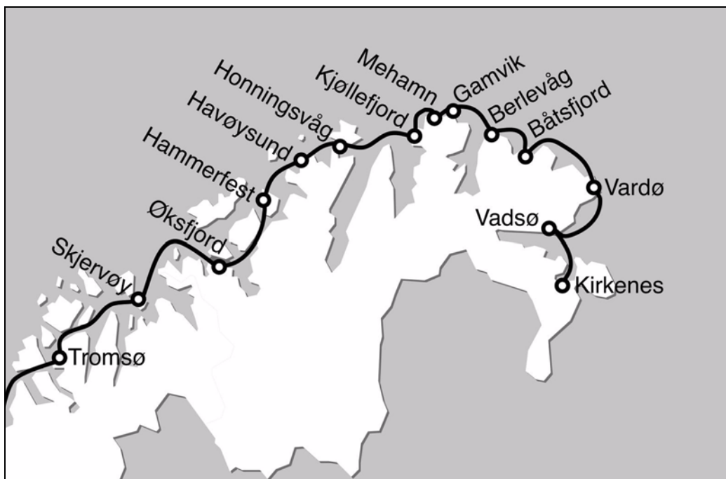
Hurtigruten var en livsnerve som bandt Finnmark sammen. I tillegg til dens betydning for handel, frakt og pasasjertrafikken, var Hurtigruten viktig for kultur- og foreningslivet i fylket. Alle anløpsstedene, med unntak av Kjøllefjord, hadde foreninger organisert i Finnmark Fotballkrets i 1935. Kart: Sverre Mo.

og førte til at både Kamp og Spark ofte leide inn skøyter når de skulle spille kamper, noe også lagene i Varanger gjorde. 80 Foreningene arrangerte ofte lystturer i forbindelse med kampene. Lagenes tilhengere kunne være med på utflukt og var dermed med på å betale for leie av skøyte samtidig som de ga laget god støtte under kampene. Nå viste det seg alt i 1923 at avstandene og kommunikasjonene likevel ble for problematiske til at kretsen kunne sende lag fra den ene delen av fylket til den andre.