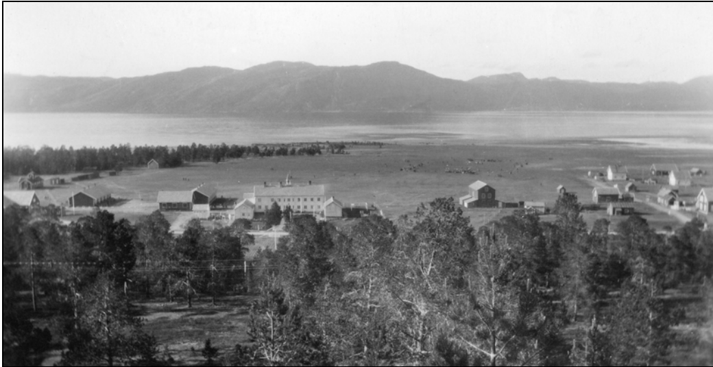
Altagård på Elvebakken spilte en sentral rolle i utviklingen av fotballen i Vest-Finnmark slik Nyborgmoen gjorde i Øst-Finnmark. Forsvaret var velvillig innstilt til fotballen og tilbød gode baneforhold og ble derfor et viktig møtested for de aktive fotballforeningene. Bildet viser Altagård med sine store gressletter. I bakgrunnen ser vi en fotballkamp omkranset av tilskudere.

delta. 102 Fotballforbundet ivret mer for å styrke Nordnorgesmesterskapet. Dette løste to problemer samtidig. Det ga de nordnorske klubbene et konkurransetilbud og det tok bort noe av det nordnorske presset for å bli inkludert i allnorsk spill.