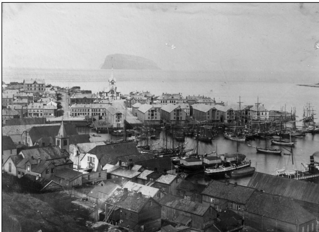
Selv om Hammerfest hadde et meget aktivt idretts- og foreningsliv og var et knutepunkt for handel og kommunikasjon på begynnelsen av 1900-tallet, ble ikke fotballen tatt opp i organiserte former før rundt 1920. Bildet viser Hammerfest sentrums indre havn, med den katolske kirken i forgrunnen, slik byen framsto noen år etter brannen i 1890.

det ene prøveåret. 48 Turneringen i 1925 var nok likevel viktig for institusjonaliseringen av det «nordnorske fotballmesterskapet» som kom i 1929, et mesterskap som kom til å bli en bærebjelke i den nordnorske fotballen helt fram til 1970-tallet. Turneringen fikk offisiell status og ble støttet av Norges Fotballforbund med 1500 kroner i startkapital. Mesterskapets status ble ytterligere hevet i 1934 da vinneren av mesterskapet ble tildelt kongepokalen. 49 Det ble bestemt at det første nordnorske fotballmesterskapet skulle avvikles uten finnmarksklubbenes deltakelse fordi økonomi og avstander ikke tillot deltakelse. 50 Etter sterkt press fra Finnmark ble dette vedtaket omgjort i siste liten slik at både KIF og Vardø Fotballklubb fikk delta. Det var påmeldt 16 klubber fra Mo i sør til Kirkenes i nord. Organiseringen av fotballmesterskapet skapte umiddelbart stor entusiasme og interesse og deltakelsen vokste jevnt og trutt. I 1932 var