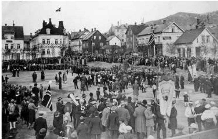
Framsidedfoto: Byjubileet på «Frimerket» 29.mai 1926. Folk i byen møttes til felles markering for seg og byen sin etter 25 år med bystatus.