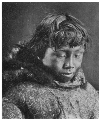
FIG. 12.—A Belcher Island Eskimo boy in eider duck costume. Skins reversed, feathered surface inside. The boy's left cheek is frozen.