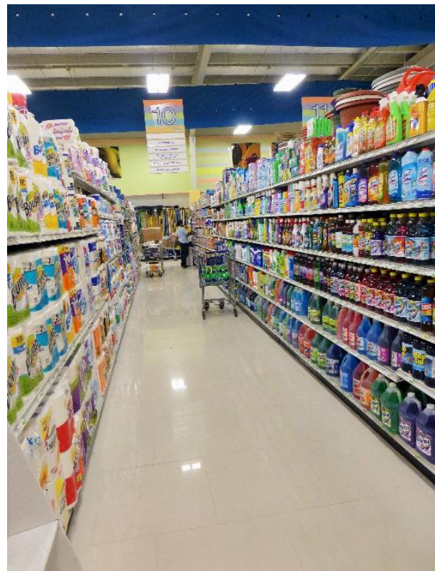
Hyller med utvalget av rensedmidler i butikken Caribbean.

Følger man vegen fra Delmas 33 oppover fjellsiden, kommer man til Pétionville. Her er det litt kjøligere, de fleste husene har høye murer rundt seg og de fleste som har penger, bor i dette nabolaget. De fleste ambassadene ligger her, det samme gjelder for de store luksushotellene, restaurantene og for hovedkvarterene til mange av bistandsorganisasjonene. I løpet av oppholdet mitt har jeg vært ganske mange ganger i Pétionville. Selv om man ikke bor her, så tilbyr området mange gjøremål for de rike beboerne av Port-au-Prince. Mye av maten ble kjøpt i det store supermarkedet Caribbean. Butikken er svær, iskald og tilbyr omtrent alle matvarer man kunne savne når man flytter fra et annet land til Haiti – til og med Wasa knekkebrød. Mens man nesten