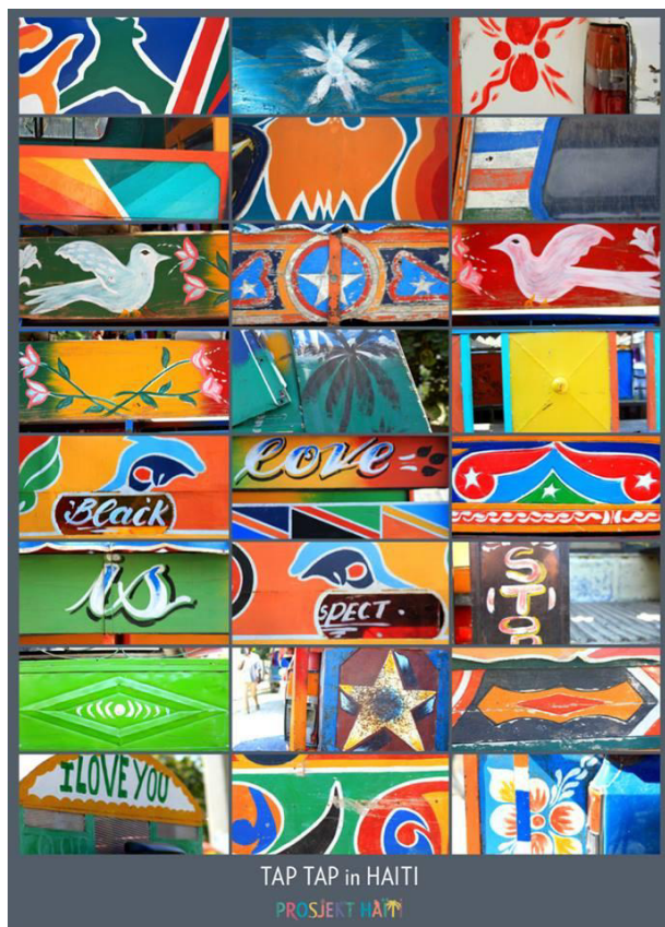
Plakat med utsnitt av haitianske Tap Tap-busser som selges gjennom Prosjekt Haiti.

Til og med skolen i St. Louis er bygget av norske ferdigproduserte byggevarer som bare ble satt opp i Haiti. Dette gir den daglige lederen imidlertid uttrykk for å være skeptisk til i dag, siden Prosjekt Haiti foretrekker å bruke lokale materialer. Derfor bygges for eksempel gjestehuset i hovedsak av haitianske materialer og i en haitiansk stil.