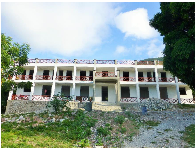
Råbygget av gjeste- og samfunnshuset Kay La Madame i sommer 2014.

En idéprosess, som viser hvordan begge land har innflytelse på utviklingen av idéer, er byggingen av Prosjekt Haitis nye gjestehus. Gründerne av Prosjekt Haiti forteller om gode grunner for å bygge dette gjeste- og samfunnshuset og disse grunnene har opprinnelsen sin både i Norge og i Haiti. I flere av intervjuene mine og i flere av samtalene som ble ført under opp-