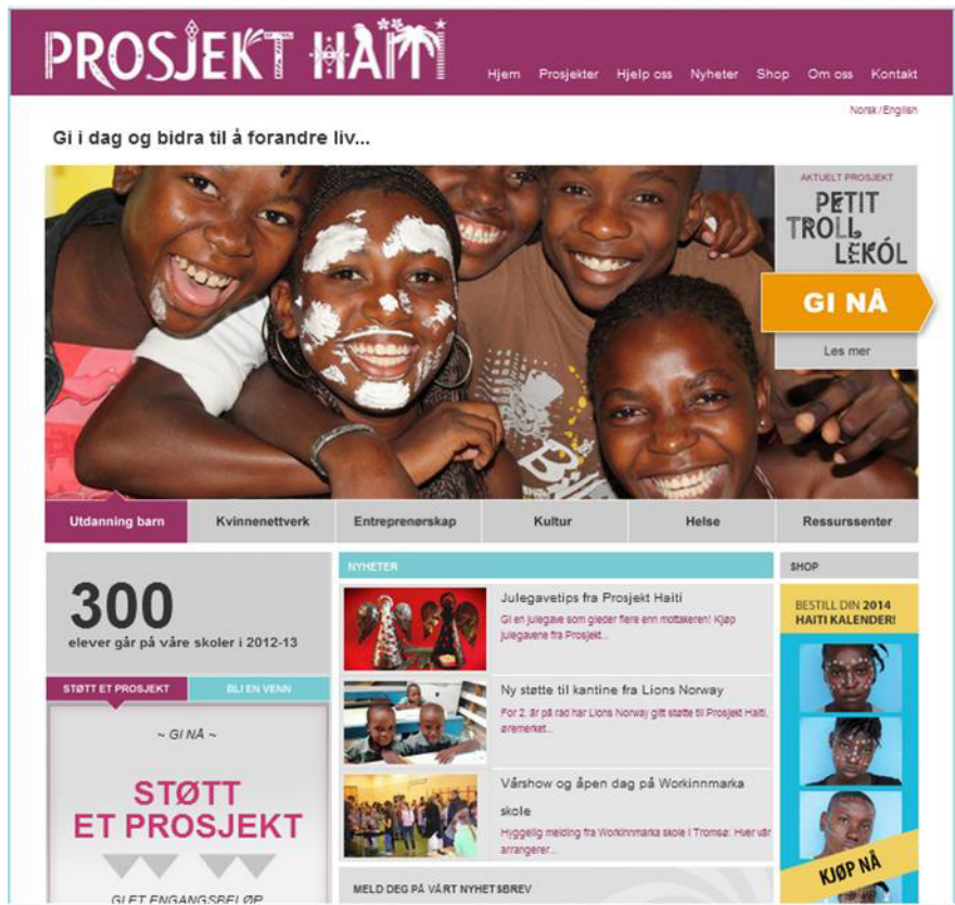
Screenshot av Prosjekt Haitis aktuelle nettside.

besøkende muligheten til å kjøpe en kalender – «kjøp nå», oppfordres det. Slike direkte oppfordringer for å støtte Prosjekt Haiti fantes det ikke på den tidligere siden. Også ordbruken har endret seg: I dag presenterer Prosjekt Haiti seg ikke lenger som «hjelpesorganisasjon» og «hjelpesprosjekt», som det står tydelig på den utdaterte nettsiden, men det mer nøytrale ordet «stiftelse» brukes og det legges vekt