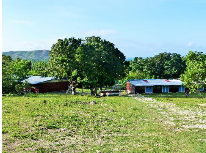
Prosjekt Haitis tomt med de to skolebyggene i St. Louis.

I dag finnes det to Petit Troll -skoler: Den opprinnelige i Port-au-Prince og en ny skole som ble bygget i 2011 i landsbyen St. Louis, cirka tre kjøretimer unna Port-au-Prince. Skolen i Port-au-Prince har i dag cirka 100 elever og skolen i St. Louis 200. De første to årene etter oppstart har moren til den haitianske gründeren ledet skolen i Port-au-Prince, men i dag er det en av lærerne som har vært lengst ved skolen som har denne oppgaven. I starten kunne elevene begynne