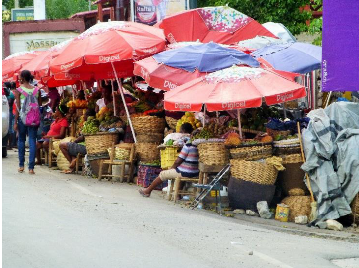
Et marked langs gaten i Port-au-Prince.

ikke ser mennesker med lys hud på gatene i Port-au-Prince, så endrer dette bildet seg totalt når man står i Caribbean: Plutselig ser man overalt mennesker som mest sannsynlig ikke er haitianere, og de som antageligvis er haitiansk, er ofte mulattos . Det samme inntrykket får man i de store hotellene som ligger strødd over Pétionville. Også her er menneskene inne i hotellene veldig forskjellig fra menneskene foran hotellene.