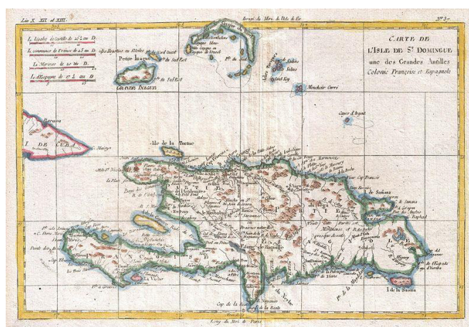
Historisk kart øya Hispaniola, tegnet av Rigobert Bonne i 1780. Til venstre vises det spissen av Cuba.

Før Columbus oppdaget øya Hispaniola i desember 1492, bodde det en gruppe innfødte amerikanere i Haiti, kalt Tainos. Det er usikkert hvor stor befolkningen på Hispaniola var, men det finnes tall mellom 100 000 og to millioner. Siden det fantes gull på Hispaniola, ble Tainoene brukt som slaver i gruvene. I 1519, bare 27 år etter at Columbus oppdaget Hispaniola, var det bare 11 000 Tainos igjen,