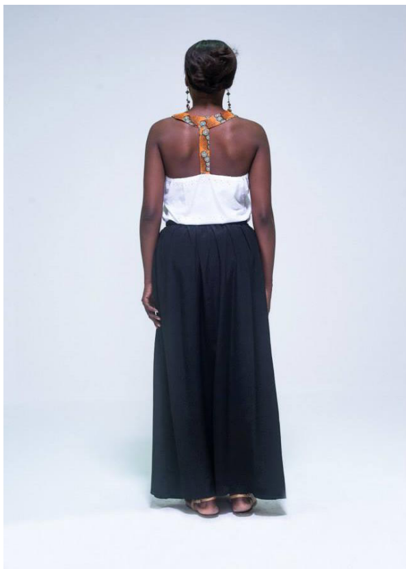
Bilde av Manman Trolls kleskolleksjon.

Gjenstander flyter, som bagasje til mennesker som reiser, mye mellom Norge og Haiti. Det er derimot forskjellige gjenstander som flyter i hver retning. Fra Norge til Haiti flyter i hovedsak gjenstander for skolen, for fritidsaktiviteter og entreprenørskap. Dette kan være papir, blyanter, kunstmateriell og lignende for skolen, fotballer, fotballsko, fotballmål for fotballklubben, frisørutstyr til frisørsalongen og lignende.