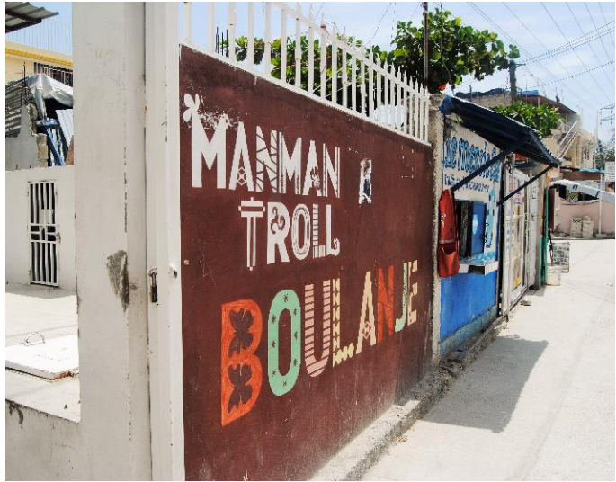
Inngangen til Prosjekt Haitis bakeri.

I 2012 åpnet Prosjekt Haiti et bakeri som ble bygget i samarbeid med studenter fra et norsk universitet. Noen av kvinnene fra Manman Troll er ansatt i bakeriet og får opplæring som bakere. De ansatte i bakeriet er imidlertid ikke bare kvinner fra Manman Troll , men også mannlige faglærte bakere. I tillegg til de kvinnene som jobber i bakeriet, kjøper cirka 40 til 60 kvinner brød fra bakeriet for å selge det videre på gaten. Noen kvinner har fått en liten kreditt fra Prosjekt Haiti for å kunne begynne å kjøpe og selge brød.