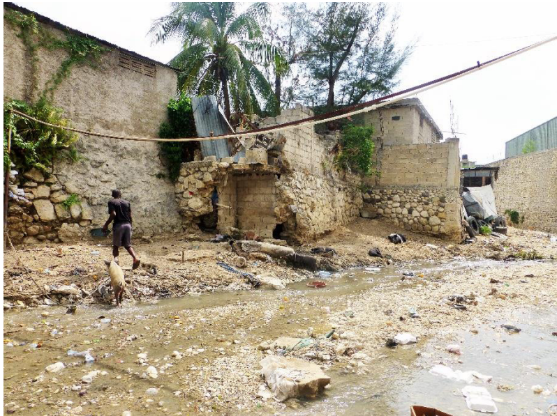
Slumområdet i Delmas. Her kommer mange Petit Troll-elever fra.

den andre siden uten å vasse gjennom kloakken ligger det noen godt plasserte flate steiner i vannet, som skolebarna går over hver morgen og som også vi brukte. Sjøppel flyter i vannet og har satt seg fast i kantene av kloakken, på bredden soler en stor purke seg med smågrisene. De husene som ligger nærmest kloakken blir ofte oversvømt av det skitne vannet når det regner mye. Husene her er ofte veldig