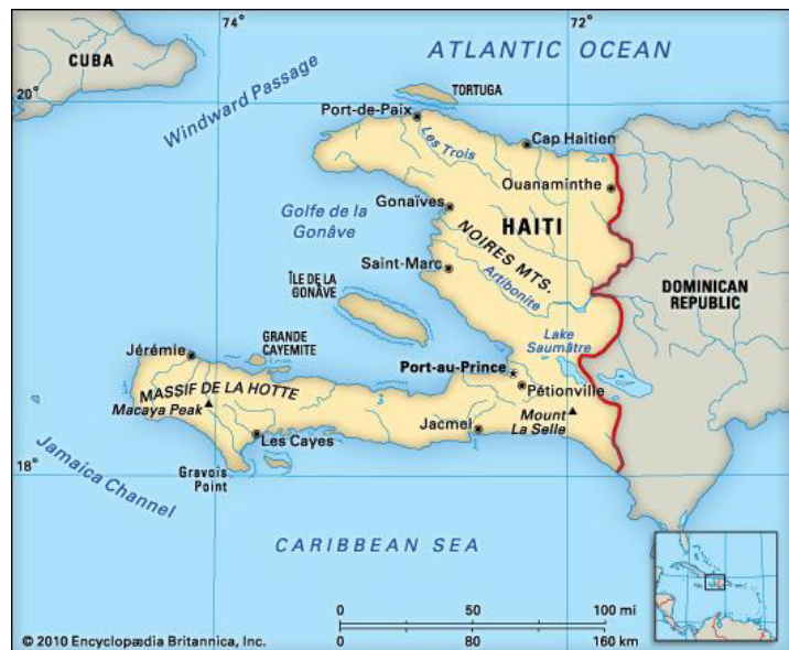
Dagens Haiti, kart av Encyclopædia Britannica Kids, 2010.

De neste 14 årene utspilte det seg en borgerkrig i Haiti. Landet ble delt opp i en nordlig og en sørlig del og så gjenforent igjen i 1820. Haiti invaderte også den østre delen av øya, slik at hele øya var under haitiansk kontroll. Dette, og at Frankrike i 1825 anerkjente Haiti som en uavhengig stat, førte til en ganske rolig periode fram til 1860-tallet (ibid. 40 sqq.). Frankrike godtok imidlertid ikke Haitis uavhengighet uten å kreve en stor erstatningssum for tapene