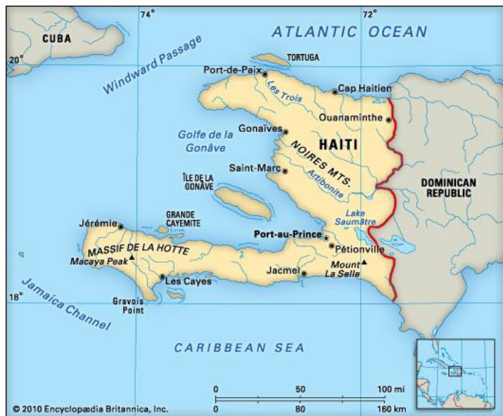
Dagens Haiti, kart av Encyclopædia Britannica Kids, 2010.

De neste 14 år utspilte det seg en borgerkrig i Haiti – den nordlige delen ble ledet av kong Henry Christophe, den sør-vestlige delen av presidenten Alexandre Pétion (ibid. 40 sq.). Alexandre Pétion døde i 1818 og ble etterfulgt av Jean Pierre Boyer. Henry Christophe begikk selvmord i 1820, noe som førte til at Haiti ble gjenforent under Boyer. Boyer invaderte også den østre delen av Haiti, slik at hele øya var under haitiansk kontroll. Dette, og at Frankrike i 1825