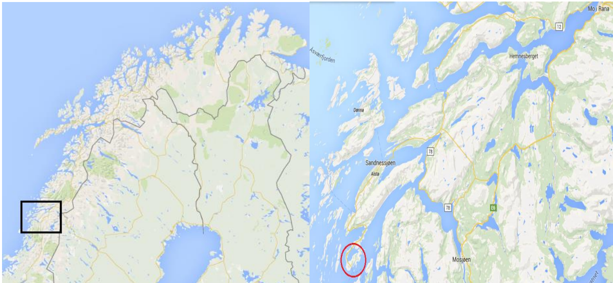
Figur 11 kartutsnittet til høyre er Tjøtta markert med rød ring rundt.