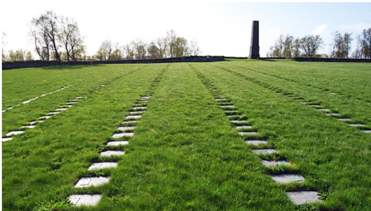
Figur 2: Bildet er fra Tjøtta krigsgravplass 87

sovjetiske myndigheter. Dette forsterker bildet av at «Operasjon Asfalt», slik jeg ser det, var en hasteaksjon, i hvert fall var den det i begynnelsen, i Finnmark og Nord-Troms. Som skapte sterke reaksjoner i opposisjonen, som kulminerte med «Kirkegårdskrigen» på Mo kirkegård 2. november 1951.