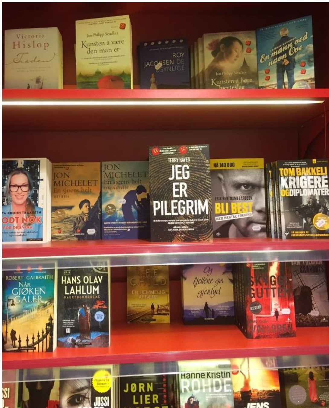
Same bokhyll fotografert medio oktober 2015. Som me ser er Roy Jacobsen si roman De usynlige ei av bøkene.