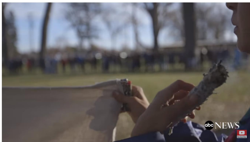
Figur 21. En person som holder et banner, samtidig som personen fører rykende salvie mot ansiktet ( The Seventh Generation 2017 30:14 ).

Der det forrige eksemplet tok for seg brenning av salvie alene som en seremoniell akt, foregår majoriteten av brenning av urter i samspill med andre artikulasjoner for urfolksreligiøsitet. Eksemplet som følger viser at brenning av urter er et element i de fleste snevre seremonier i filmen. Eksempelet tar for seg den første delen av 'The Forgiveness March' , der det ble holdt en tale for alle som skulle delta. Før man ser noen av bannerne, ser man et nærbilde av en person som holder en del av ett banner samtidig som vedkommende holder en bunt rykende salvie. Personen fører røyken fra salvien rundt og mot ansiktet, som tyder på at det er et renselsesritual. Jeg tyder det som at personen 'vasker seg med røyken'.