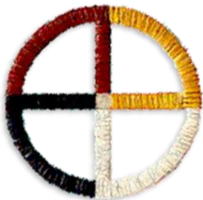
Figur 5. Bildet viser medicine wheel som symboliserer de forskjellige himmelretningene med vedrørende farger. ( St. Joseph's Indian School 2018)

As part of the Lakota culture, when people pray or do anything sacred, they see the world as having Four Directions. From these Four Directions — north, east, south, west — come the four winds. The special meanings of each of the Four Directions are accompanied by specific colors, and the shape of the cross symbolizes all directions. Like many Native American beliefs and traditions, specific details regarding colors associated with directions varies. ( St. Joseph's Indian School 2018). 48