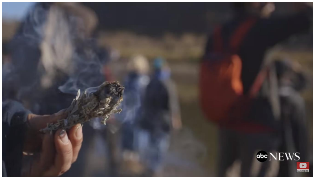
Figur 10. Bildet viser en brenning av urt under en aksjon. ( The Seventh Generation 2017 0:39 ).

Under seremonier blir ofte urter benyttet, opprinnelig var salvie den urten som ble brukt på sletteområdene. Nå er ikke bruken av forskjellige urter reservert til geografiske områder. Urtene som gjerne blir brukt er seder, marigras, salvie, tobakk, furunål, eller einer. Urtene kan både bli brent som en egen seremoni eller bønn, eller som en del av en større seremoni. Ofte da som renses ritual. Røkemiddelene brukes til å rens steder, deltakere, utstyr samt som offergaver i seremonier (Paper 2007: 11).