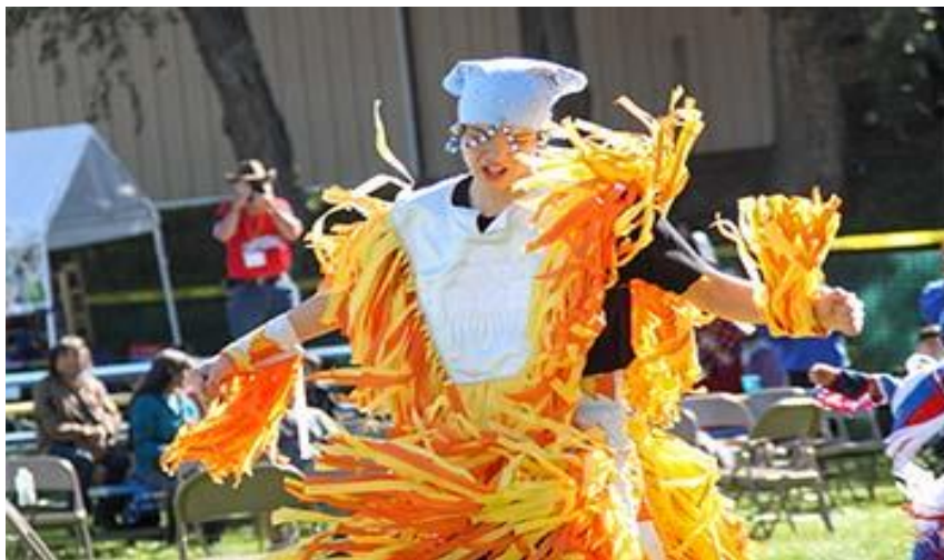
Figur 7. Ung gutt som danser Grass Dance , som er en powwow stil. ( St. Joseph's Indian School 2018).

Seremoniell dans og sang spiller en viktig rolle for Lakota-folket gjennom tidene, helt frem til samtidens Lakota. Noen av dansene som, Sun Dance , blir ansett som hellig. I samtiden begynte powwows 57 å blomstre, der presentasjonen bidrar med å styrke urfolksidentitet. For å illustrere arrangerer St. Joseph's Indian School årlige Annual Indian Day and powwows , for å dele kultur, tradisjon og arv. Barna konkurrerer i forskjellige dansestiler, som vist i illustrasjonen nedenfor. ( St. Joseph's Indian School 2018). 58