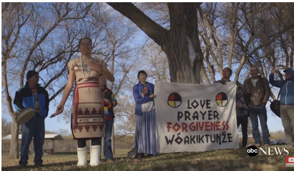
Figur 22. Tale med banner i forkant av 'The Forgiveness March' ( The Seventh Generation 2017 30:22 ).

Ved at det har vært et mindre renselsesritual i forkant av selve marsjen og talen, fremgår det at mange av de religiøse artikulasjonene overlapper med hverandre. Ved at de overlapper, tydeliggjøres de religiøse elementene ytterligere. Et renselsesritual kan praktiseres uten en forbindelse med andre seremonier, men ofte er det noe man praktiserer i forkant av en større seremoni. Slik blir da renselsesritualet, og seremonien i etterkant mer markant, fordi de overlapper. Mange av situasjonene som den ovenfor har vært viktige for bevegelsen, noe som understrekes av fokuset på det religiøse. Denne marsjen preget også mange av aktørene. I denne situasjonen står det på banneret love, prayer, forgiveness og wóakiktunže - tilgivelse, sammen med to symboler for de fire himmelretninger. Under talen hører man tromming og sang, som er elementer (i tillegg til brenning av urter) man ofte finner i seremonier blant Native Americans .