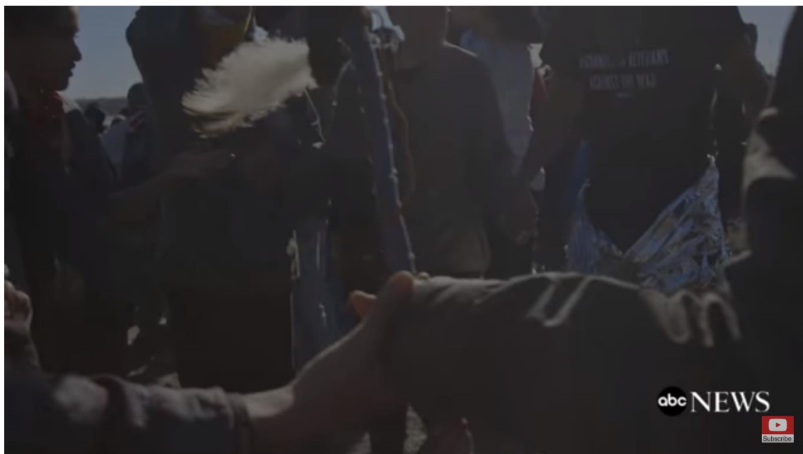
Figur 11. Gruppe som danner ring ved å holde hender. ( The Seventh Generation 2017 4:37 )