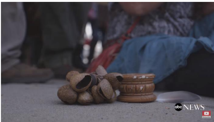
Figur 18. Objekter fra talen på slutten av 'The Prayer March' ( The Sevnth Generation 2017 23:26 ).