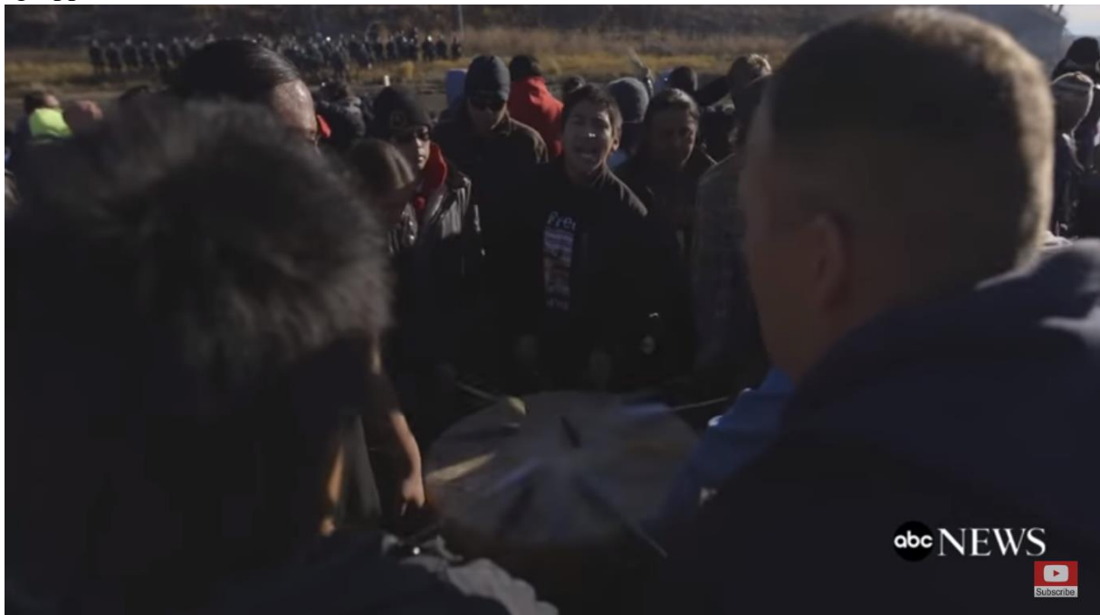
Figur 8. Bildet viser en gruppe menn som spiller. ( The Seventh Generation 2017 0:42 )

Under powwows blir det spilt trommer som en viktig del av tradisjonen. Når det spilles på store trommer, leder en person trommespillet. «Tromme lederen» begynner sangen, så kommer resten inn. Gruppene som spiller tromme sammen har gjerne forskjellige stiler og sanger de spiller. Sangene kan være skrevet av lederen av trommegruppen, eller en kombinasjon av tradisjonelle sanger man finner i de forskjellige samfunnene. Sangene som blir sunget bruker enten sangtekster eller vokaler, eller en kombinasjon av de to. Trommene blir behandlet med respekt. De blir ikke plassert direkte på bakken, og skal ikke bli forstyrret med dårlig oppførsel. Trommene kan bli brukt i ulike situasjoner, ikke bare under sosiale, sekulære danser, eller under tradisjonelle seremonielle danser. I hovedsak består trommegruppene av menn. Noen få grupper består av kvinner, I tillegg finnes noen blandede grupper (Andrus 2005: 252).