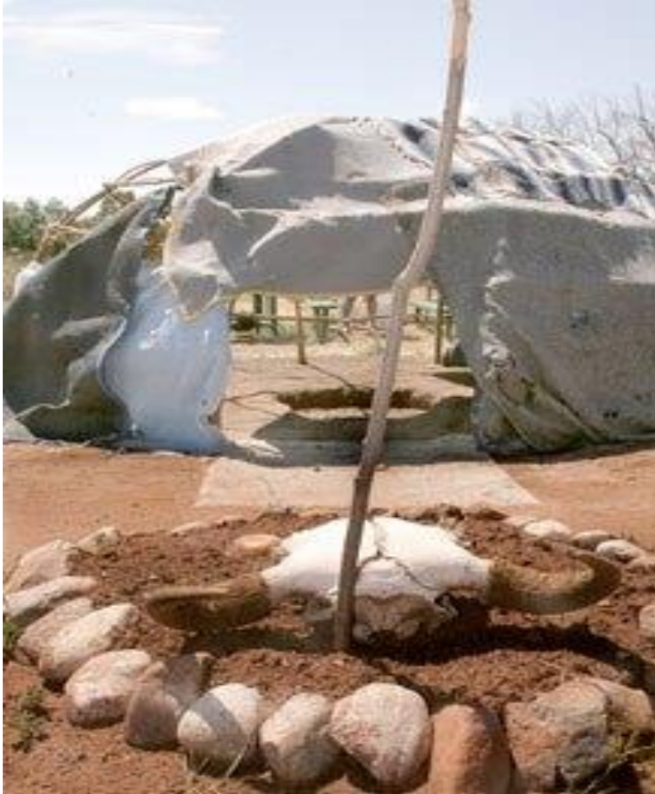
Figur 6. Lakota Sweat lodge i Colorado Springs, 2011. (Samantha B. Koss 2018)

Lakota-folket feirer overgangen fra barn til kvinne, i et overgangsritual kalt Isnati Awicalowan . 54 Seremonien blir praktisert når en kvinne får sin første menstruasjon. Seremoniens hensikt er å erkjenne betydningen av en ny Lakota kvinne, og at hun selv skal føle betydningen av den nye statusen. Læren rundt seremonien blir i de fleste tilfeller gitt av eldre kvinnelige slektninger. Noe av dette blir utført offentlig, annet privat til den unge kvinnen. Tradisjonelt sett betyr overgangsritualet at hun nå er formelt tilgjengelig for beilere. Samtidens betydning ligger i overrekkelsen, der hennes slektninger viser henne respekt (Brokenleg 2005: 144). Under utførelsen blir den unge kvinnen instruert av en seremoniell leder om hennes ansvar og forpliktelser ovenfor sitt folk og familie. En annen hensikt med ritualet er å forsterke hennes forhold til White Buffalo Calf Woman . 55 Ritualet treer i gang syv