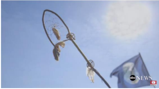
Figur 16. Drømmefanger fra 'The Silent March' ( The Seventh Generation , 2017 33:26 ).

dette er at Simon ønsker å framheve det religiøse og anti- voldelige i filmen. Ved å vise nærbilder av slike objekter, blir filmens urfolksreligiøsitet og kultur mer etablert.