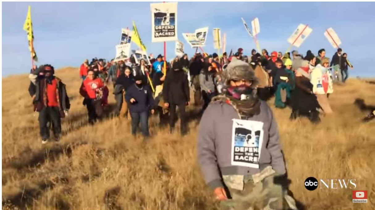
Figur 14. Aksjon med banneret med budskap 'Defend The Sacred' ( The Seventh Generation 2017 21:56 ).

formatet blir ikke mye brukt utover dette. Jeg mener likevel at det er verdt å ta med, da man ser både religiøst ladede og politiske budskap i disse eksemplene.