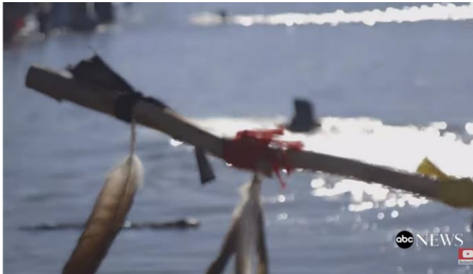
Figur 17. "Bønnepinne" fra den første aksjon i dokumentaren ( The Seventh Generation 2017 2:24 ).