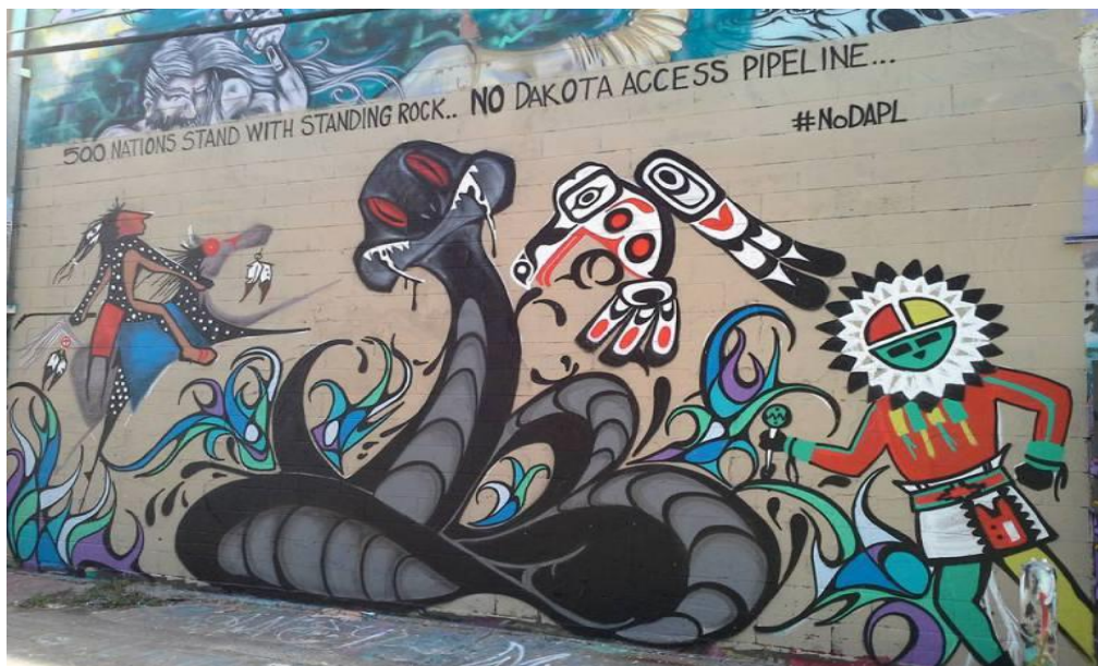
Figur 9. "How The Protectors Defeated The Black Snake" (Tyler Read, Art Alley, 2018)

Under seremonier blir ofte urter benyttet, opprinnelig var salvie den urten som ble brukt på sletteområdene. Nå er ikke bruken av forskjellige urter reservert til geografiske områder. Urtene som gjerne blir brukt er seder, marigras, salvie, tobakk, furunål, eller einer. Urtene kan både bli brent som en egen seremoni eller bønn, eller som en del av en større seremoni. Ofte da som renses ritual. Røkemiddelene brukes til å rens steder, deltakere, utstyr samt som offergaver i seremonier (Paper 2007: 11).