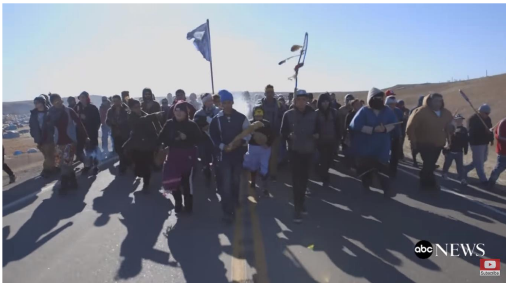
Figur 13 ‘ The Silent March ’. ( The Seventh Generation , 2017 33:47 )

Dette er ikke det eneste formatet av bønn man ser i filmen. Man ser det i tekst form på bannere fra ‘ The Forgiveness March ’. 79 Andre tilfeller er ‘ The Silent March ’, marsjen IIYC arrangerte etter hendelsen 27. Oktober, som også inspirerte ‘ The Forgiveness March ’. IIYCs marsj gikk til en barrikade, der alle deltagerne var stille og i bønn.