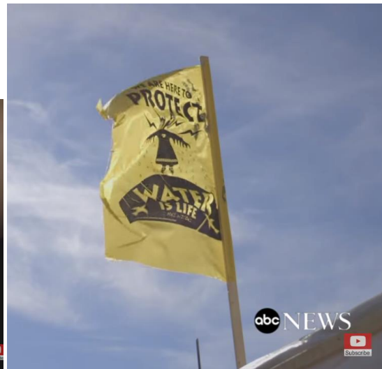
Figur 2. Mni Wiconi tatovering på armen til et av medlemmene i The International Indigenous Youth Council ( The Seventh Generation , 2017 6:33 ). Figur 3. Viser ett flagg der det står; We are here to protect – Water is life ( The Seventh Generation , 2017 16:33 ).

Det var også en underliggende frykt for at byggingen av oljerørledningen muligens ville krysse gravplasser og ødelegge sacred objects . Da området oljerørledningen skulle bli bygget gjennom, tilhørte ifølge det amerikanske lovverket Lakota-folket. 7 Demonstrantene kjempet for urfolksrettigheter, bevaring av tradisjon og Missouri-elven. Denne konflikten er mer kompleks enn en demonstrasjon mot byggingen av en oljerørledning. Den består av flere nivåer som økopolitisk, samfunnskritisk, økonomisk og politisk. Om oljerørledningen sprekker vil dette ha fatale følger for Missouri-elven og alt rundt den. Konflikten aktualiserer behandlingen av det amerikanske urfolk og deres rettigheter. Det økonomiske og politiske går hand i hand da selskapet som er ansvarlig for byggingen av oljerøret støttet president kampanjen til Donald Trump. I etterkant av å vinne valget ga Trump Rick Perry (styremedlem i ETP), 8 rollen som leder for energi avdelingen i det Hvite Hus. 9