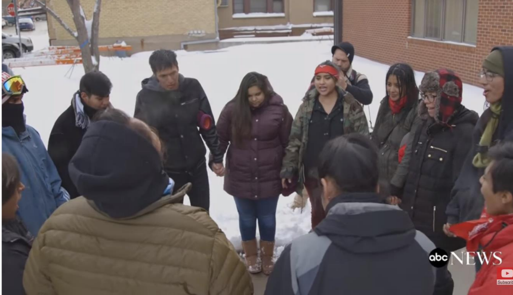
Figur 12. IIYC danner sirkel med sang utenfor politistasjon etter donasjon. ( The Seventh Generation , 2017 41:32 )

Situasjonen illustrert i figur 12 og 13 er noe man ser gjentatte ganger i filmen. Under ‘ The Forgiveness March ’ skjedde en ringdannelse med bønn og sang rundt en hel politistasjon. Et annet mindre tilfelle skjedde senere i filmen, etter at IIYC donerte ressurser til politistasjonen på vinteren.