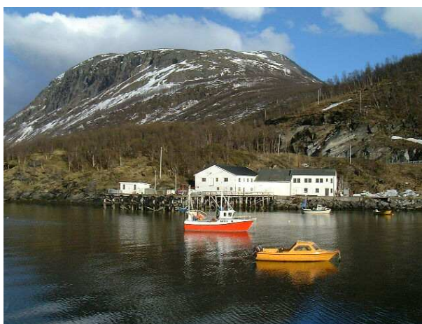
Fiskebruket på Klubbenes.

Etter vel to valgperioder ble det merkbart at det ikke var noen større politisk vilje til satsing i de to bygdene, og at nærheten til kommunesentret ikke ga noen åpenbare fordeler. Det første konkrete resultatet var at viljen til å realisere havneplanene på Klubbenes forsvant. Det ble derimot satset på havneutbygging i Sørkjosen. Med konkret resultat at de fra bygdene som ennå drev fiske med litt større båter ble nødt til å benytte Sørkjosen som havn, flytte til Skjervøy eller andre steder for å få enklere driftsforhold.