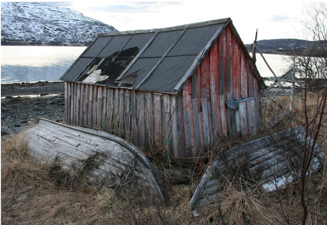
Rester av den gamle fiskerbondekulturen i Straumfjord.

Som det fremgår av figuren består de intervjuede husholdene mest av eldre mennesker, og flere er pensjonister. Jeg har bevisst valgt hushold av denne typen for å kunne analysere hvordan bygdene har endret seg over tid. De fleste informantene husker derfor det store ”hamskiftet” hva angår næringsutøvelse og sysselsetting som startet opp i bygdene fra omkring 1960 og utover. Videre har flere av husholdene vært innom ulike beskjeftigelser både før og etter at de kom tilbake til bygdene. Noe jeg mener bidrar til at de har gitt et mer nyansert bilde av hvorfor de kom tilbake til bygdene hvorfor de fortsatt er bosatt der.