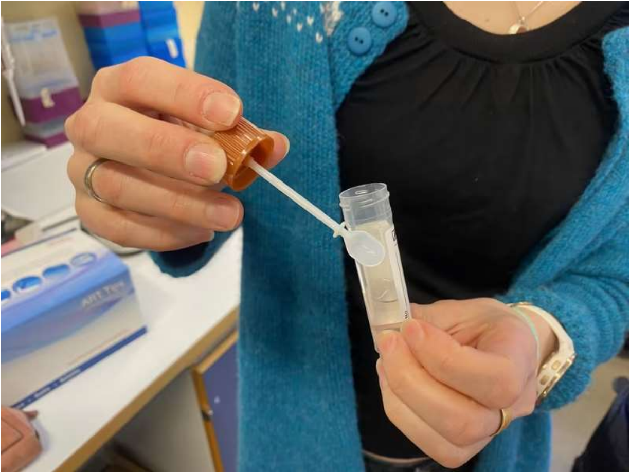
PRØVEGLASS: Avføringen skal inn her.

Han legger til at de forsker på unge som er friske, slik at det kan sammenlignes med lignende studier som er gjort på barn og unge som er syke.